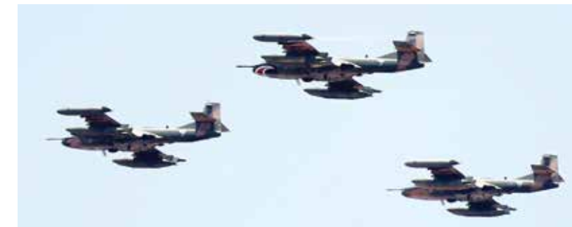
La implementación de escudos aéreos y marítimos logró reducir el paso de droga por el territorio hondureño, además se incautaron grandes cargamentos y se desarticulaban narco laboratorios en diferentes puntos del país.