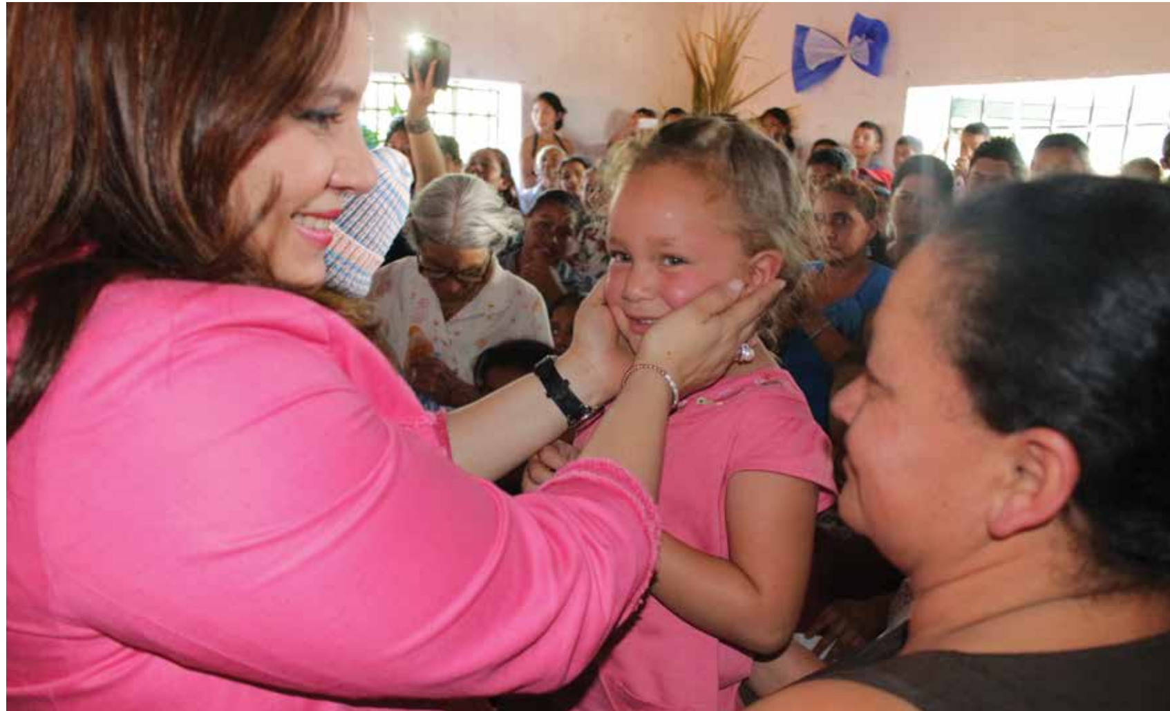
La Primera Dama Ana García respalda la labor solidaria de su esposo el Presidente Hernández por lo que se involucra directamente en los programas sociales en beneficio de la población.