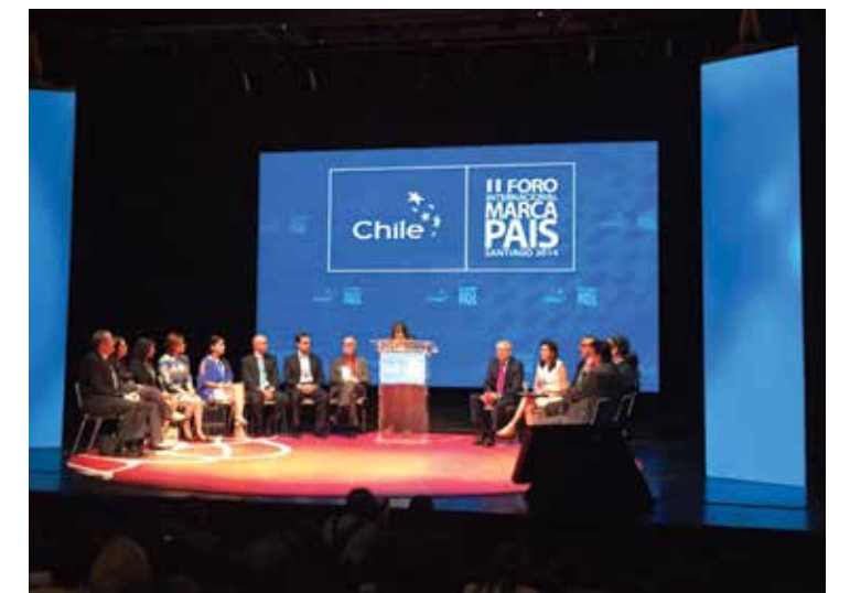
La ministra de Estrategia y Comunicación de Honduras, Hilda Hernández participó en el II Foro Internacional Marca País 2014 que se realizó a finales de noviembre en Santiago, Chile.