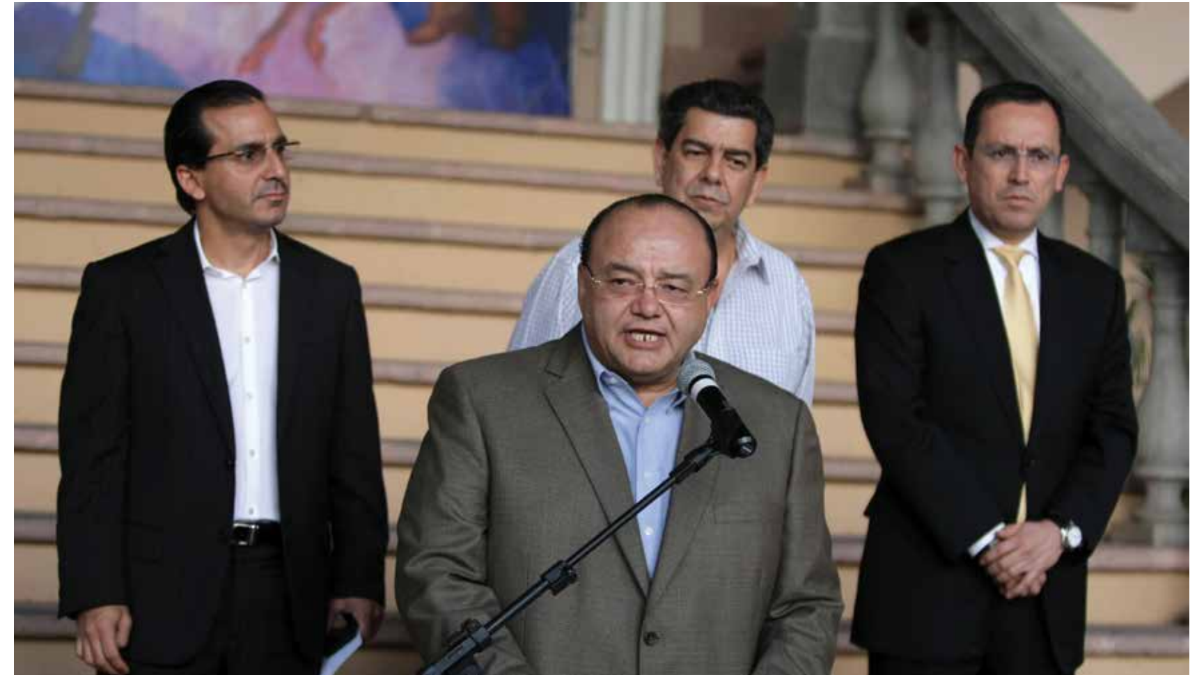
Con el firme propósito de defender los intereses del pueblo, el mandatario hondureño logró arrancar una exitosa negociación con las empresas generadoras de energía térmica, que le dejará un ahorro de 1,700 millones de Lempiras al Estado.