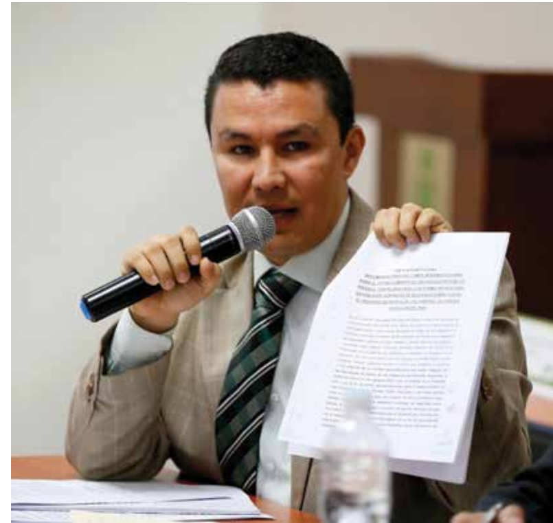
El Gobierno reformó el Instituto de la Propiedad para garantizar seguridad jurídica, servicios ágiles, transparentes y la propiedad en todas sus formas.