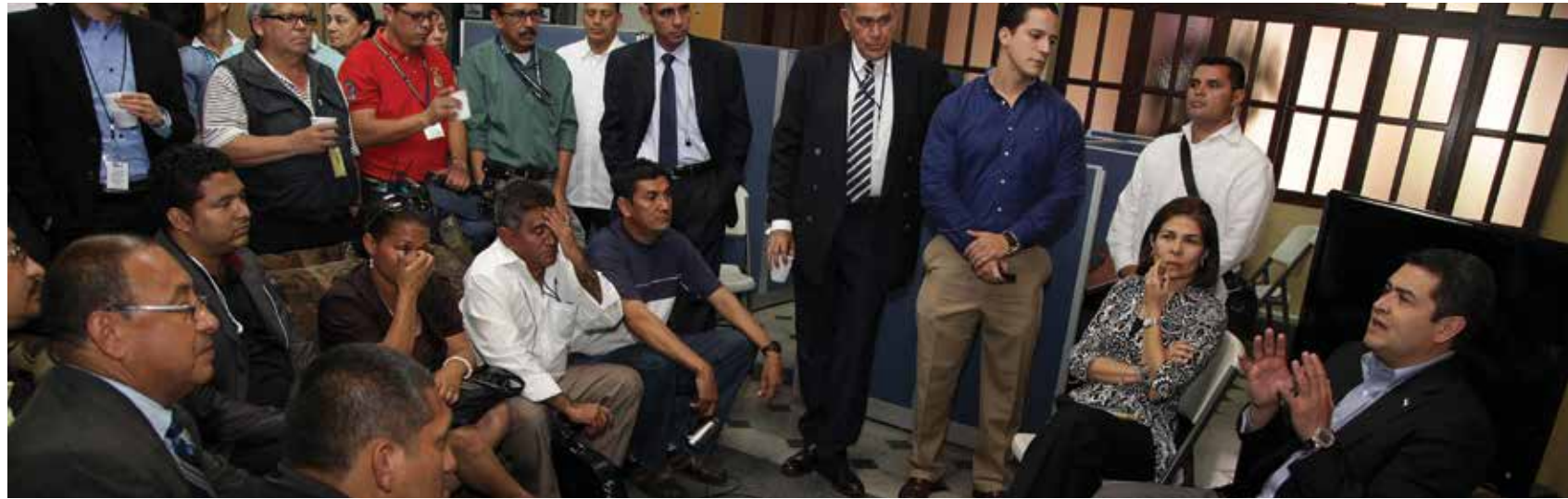
Desde la Secretaría de Estrategia y Comunicaciones se trabaja en fortalecer la libertad de expresión y de prensa, establecer una relación con los medios en una comunicación amplia e incluyente.