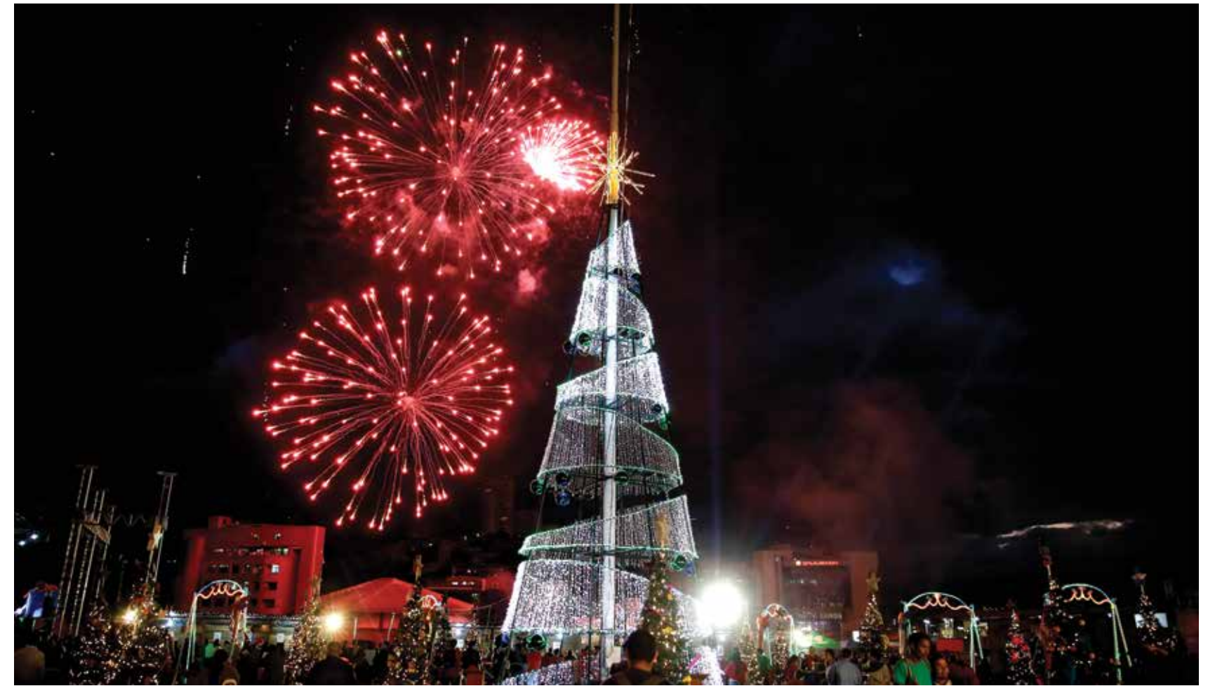
Más de 85 mil personas asistieron a la Villa Navideña que se instaló en la Plaza la Democracia de Casa Presidencial.