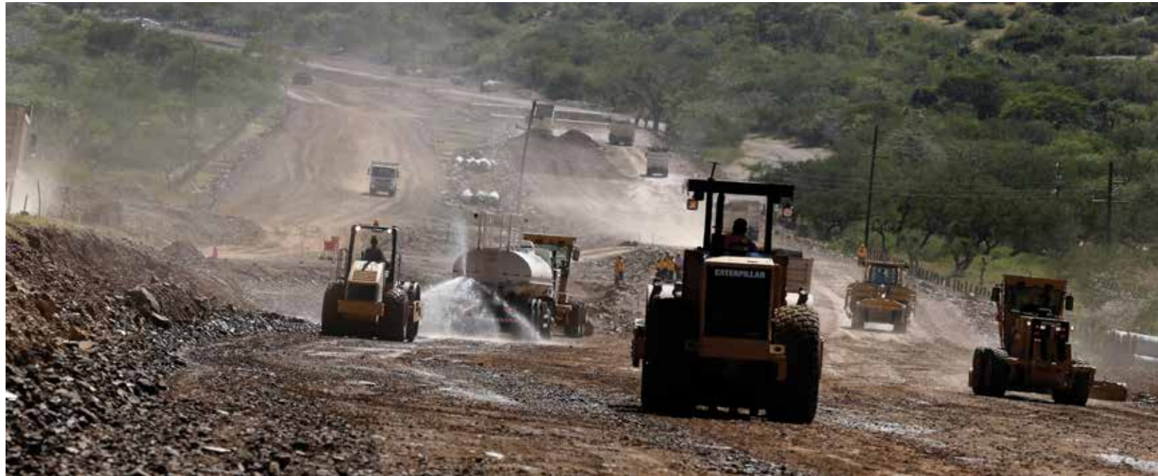
Con la construcción del Corredor Logístico el Gobierno está dando pasos firmes para conectar comercialmente los dos océanos y aprovechar por primera vez comercialmente la ventaja geopolítica de tener puertos en el Pacífico y el Atlántico.