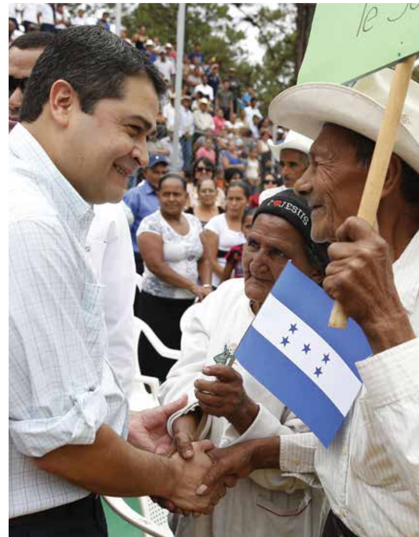
La administración del Presidente Hernández centra su accionar gubernamental en el Plan de Todos para una Vida Mejor, cuyo enfoque principal es garantizar igualdad de oportunidades para todos los hondureños.