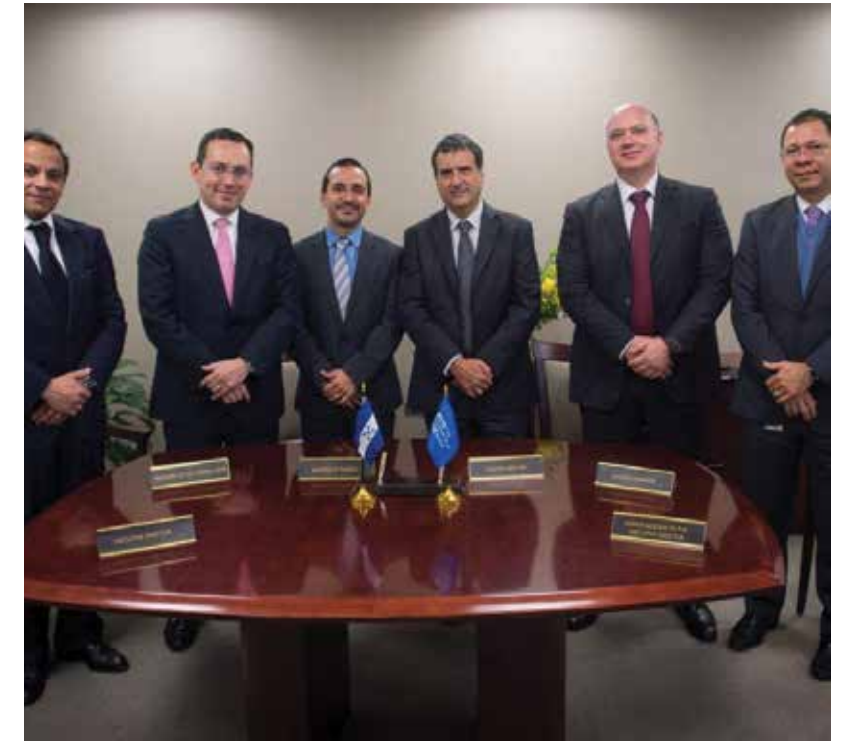
Se logró firmar un préstamo por $460 millones con el Banco Mundial, que serán destinados a programas en pro del desarrollo del país.