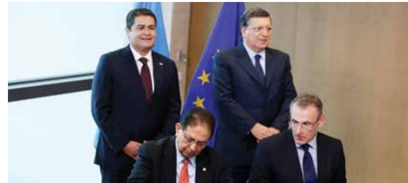
En su gira a Bélgica el Presidente Hernández suscribió el Programa Indicativo Multianual que permitirá durante el 2014-2020, el desembolso de EUR 235 millones por parte de la Unión Europea.