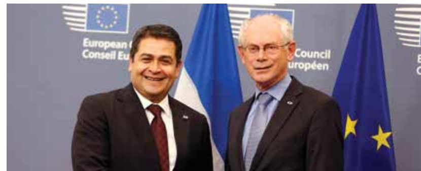
Durante sus visitas oficiales el Presidente Hernández firmó trece convenios bilaterales de cooperación no-reembolsable para migración, seguridad, comercio y previsión social entre otros.