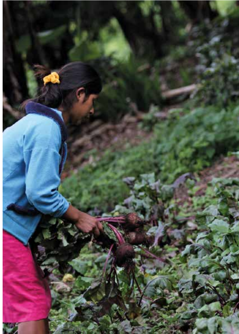
En el 2014 el Gobierno implementó los Huertos familiares, comunitarios y escolares para garantizar la siembra de alimentos.