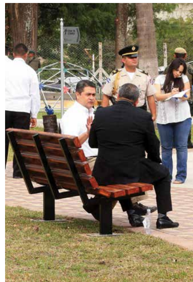
Parques Por una Vida Mejor le brindarán a la población espacios seguros fomentando la cohesión social y brindando oportunidades de crecimiento personal y de cuidado de la salud.