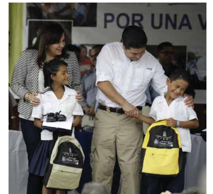
Desde el gabinete de Desarrollo e Inclusión Social el Gobierno impulsa programas para mejorar la calidad de vida de la población más desprotegida.