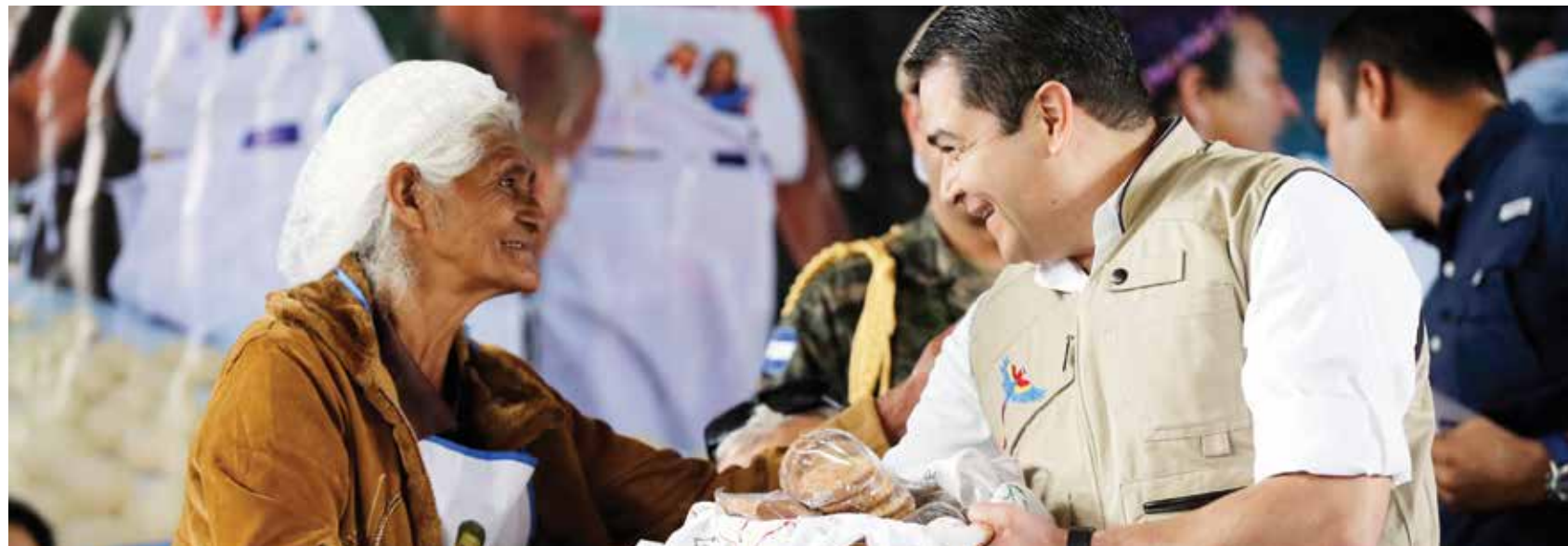
La generación de más de 4 mil microempresas de tortilla y maíz contribuyeron a la creación de 25 mil nuevos puestos de trabajo y la generación de 105 millones de lempiras mensuales.