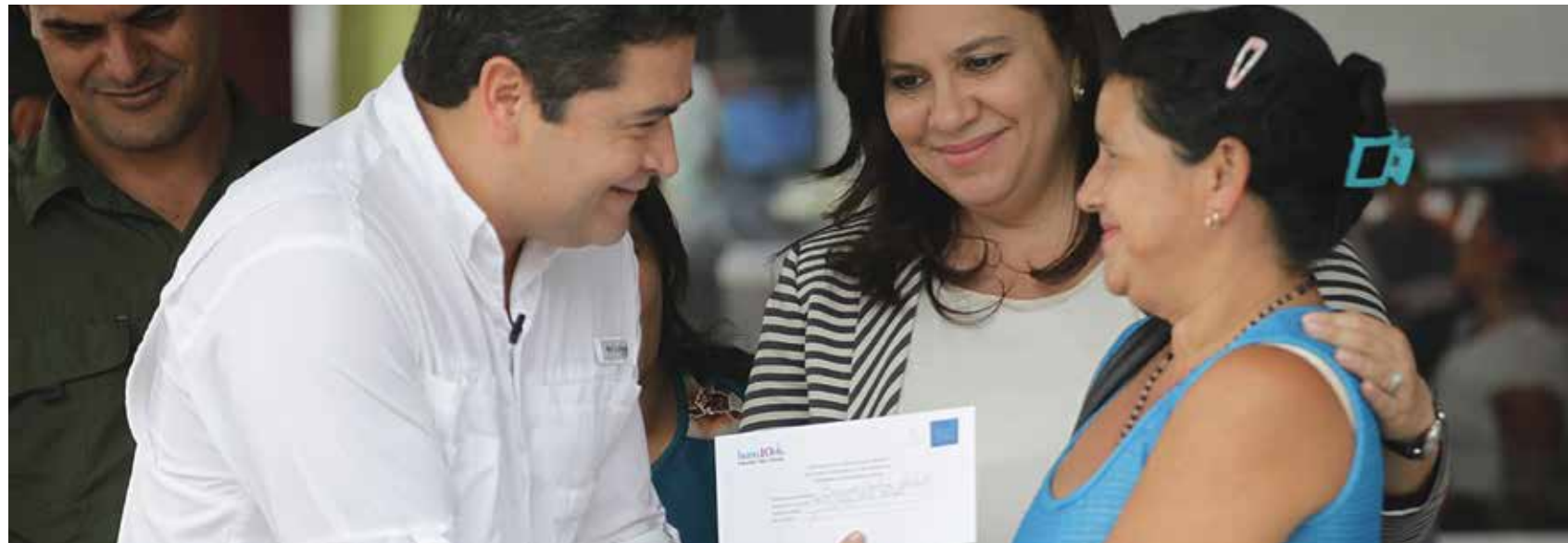
Más de 274 mil familias fueron beneficiadas con el Bono Vida Mejor, lo que garantiza que los niños y niñas que viven en extrema pobreza asistan a la escuela y se atiendan en los servicios de salud.