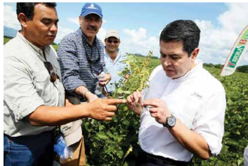
Para lograr la inclusión financiera y el desarrollo competitivo de pequeños productores agrícolas, el Presidente Hernández aprobó en el 2014 L 1,500 millones al Fideicomiso para Reactivación del Sector Agroalimentario, FIRSA.