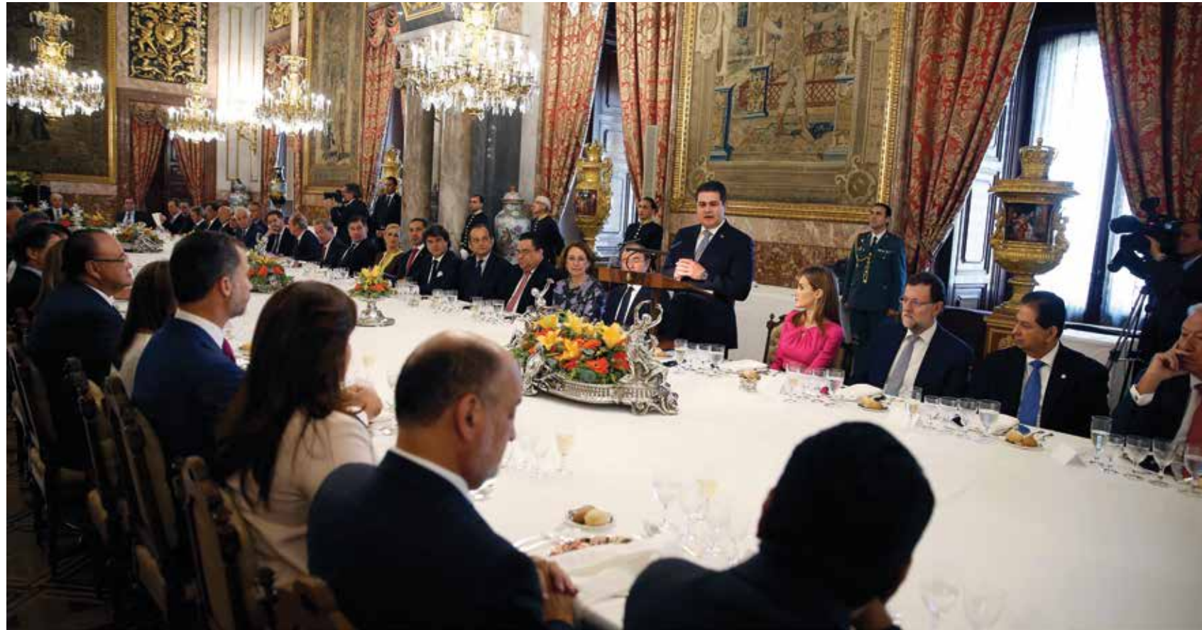
En su visita a España, el Presidente Hernández Alvarado firmó con el Rey Felipe VI y Mariano Rajoy, Presidente del Gobierno español un convenio de cooperación cuyo monto asciende a $189 millones.