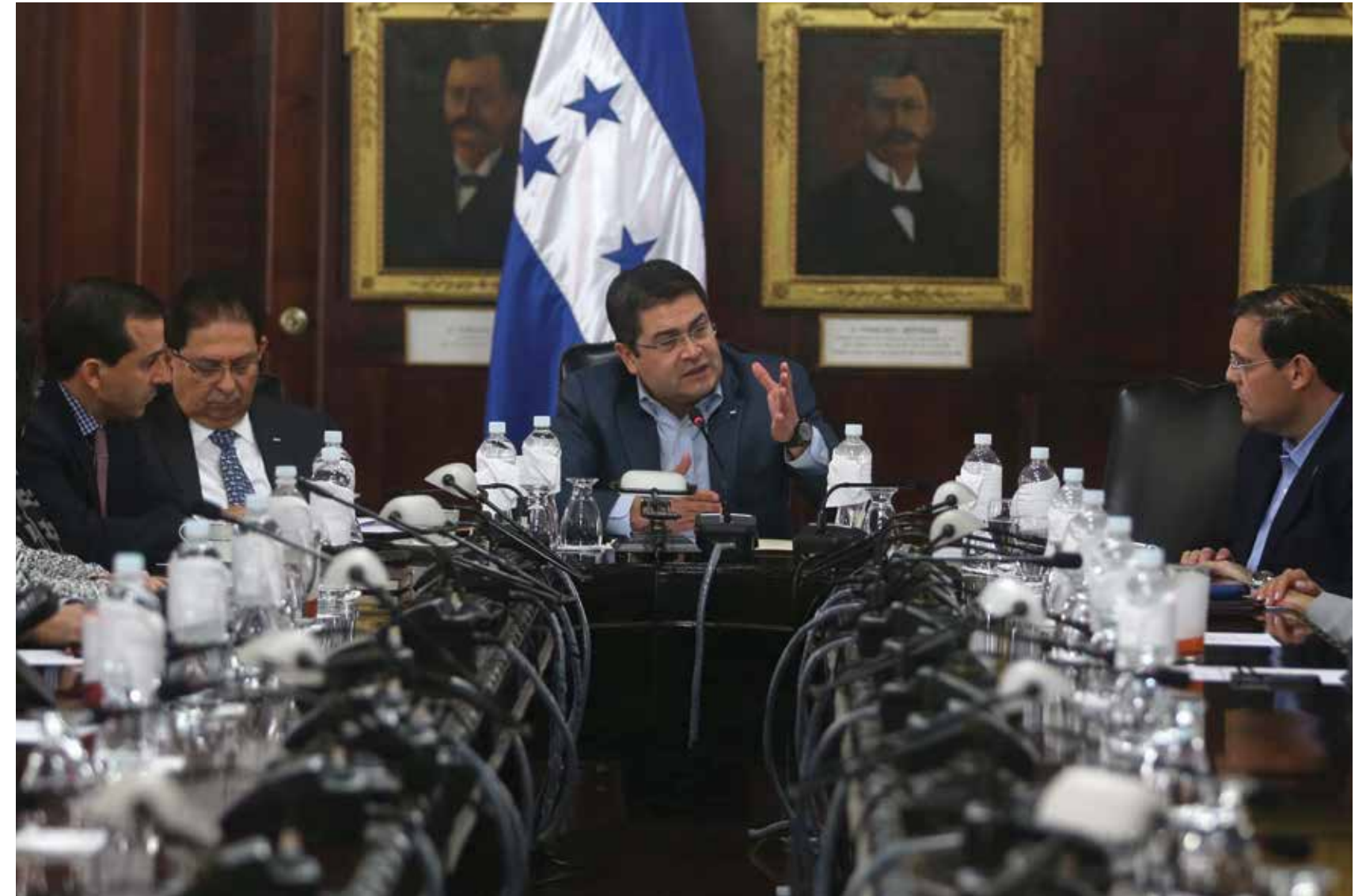
Con el objetivo de recortar el presupuesto del Estado, el mandatario hondureño comenzó su administración con la reducción de la estructura gubernamental, logrando un ahorro de más de 4,000 millones de Lempiras.