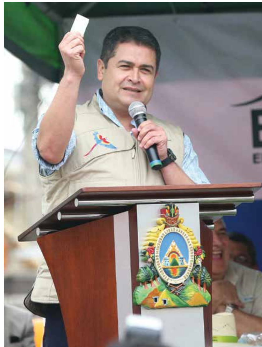
Con la apertura de Banrural, el Gobierno facilita el crédito para el micro, pequeño y mediano productor en Honduras.

En el CENET se formaron 7195 participantes (jóvenes y adultos) en temas de emprendimiento empresarial a través de las modalidades de cursos y diplomados; además de la elaboración de 11 productos técnico metodológico en Educación para el Trabajo en temas de investigación y sistematización.