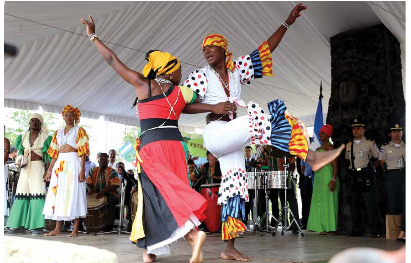
Este año las celebraciones de las fiestas patrias resaltaron los próceres, héroes nacionales y las costumbres y tradiciones de los pueblos.