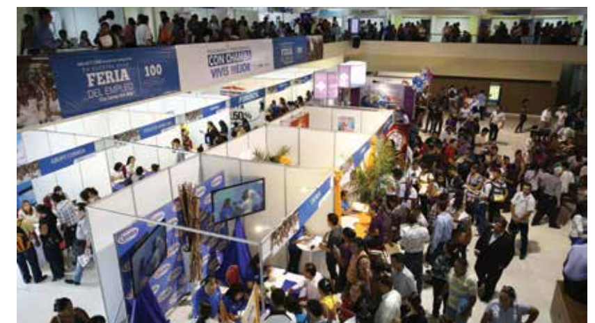
El Presidente Hernández hizo una alianza con la empresa privada y el sector agroindustrial para disminuir los índices de desempleo. Sólo en el 2014 se generaron 146 mil nuevos empleos a nivel nacional.