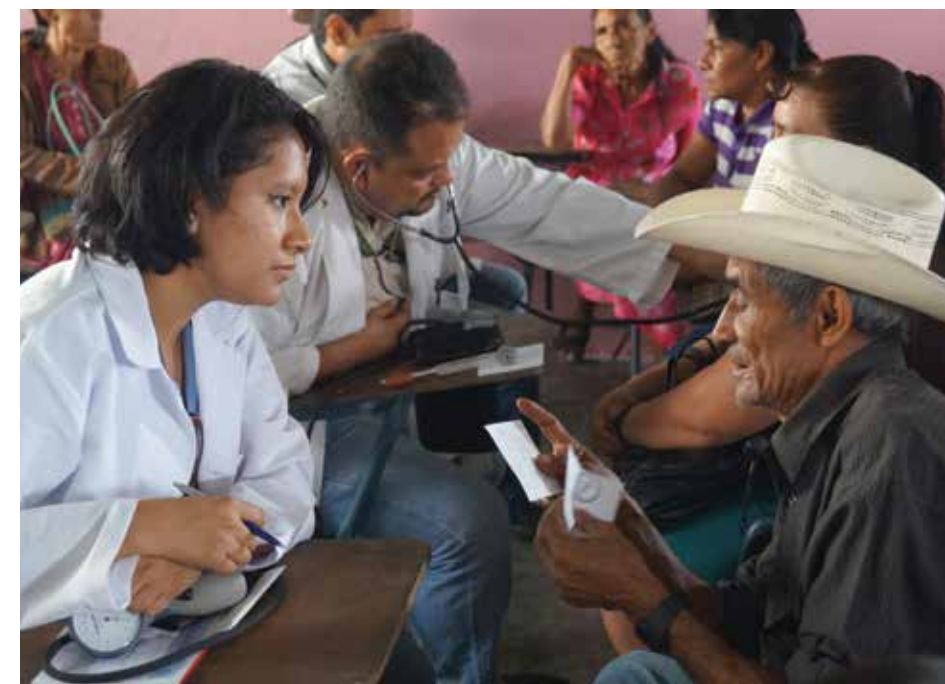
Para llevar los servicios de salud a los municipios más pobres, el Gobierno implementó un modelo de Gestión Descentralizada, mediante el cual se logró atender a más de un millón de personas de los municipios más pobres de Honduras.