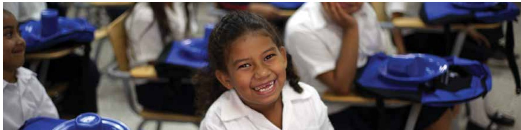
El impulso de la Tercera Reforma Educativa dio paso a más de 200 días de clases, reducción en los índices de deserción escolar, mejor rendimiento académico de español y matemáticas y un índice de 81.71 por ciento en los niños y niñas de primero a noveno grado.