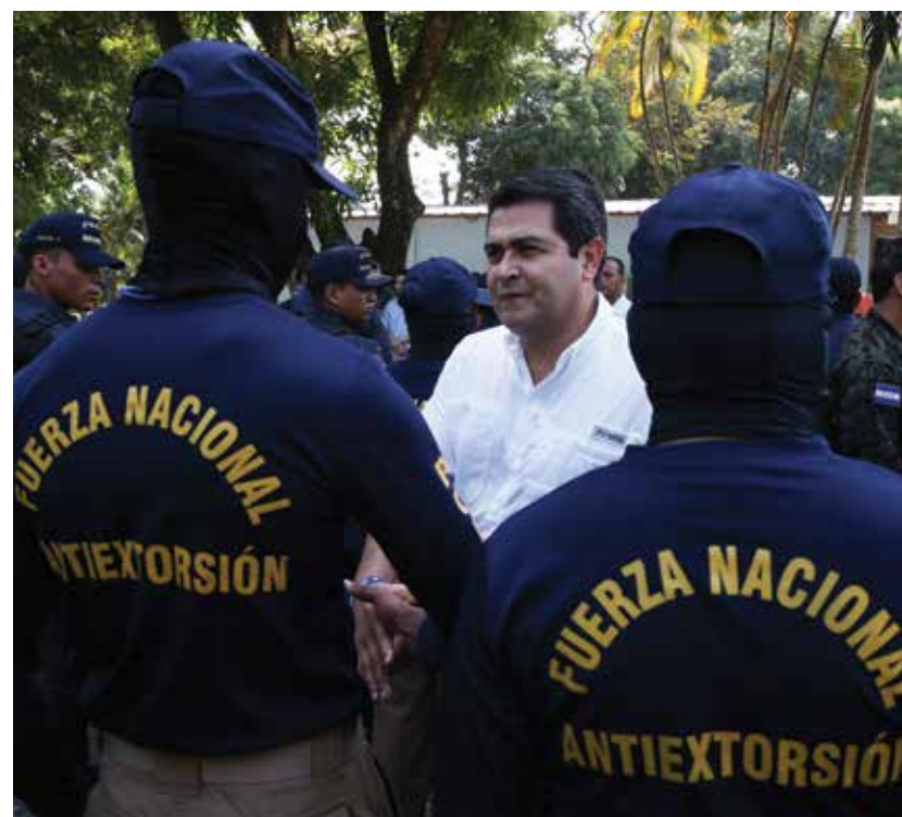
El mandatario hondureño potencializó la Fuerza Nacional Antiextorsión, a diario efectivos de esta unidad elite desarticulan y capturan bandas dedicadas a este delito.