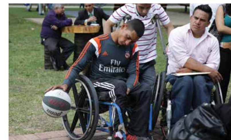
Los parques cuentan con canchas polideportivas para incentivar el deporte entre los niños y jóvenes.