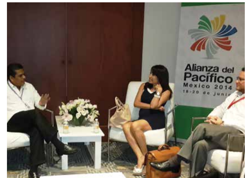
A través de ProHonduras el Gobierno obtuvo grandes resultados en materia de promoción internacional y competitividad, logrando abrir nuevos mercados de inversión y generación de empleos.