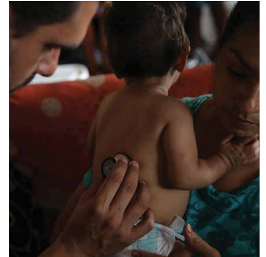
Las Brigadas Medico-Odontológicas beneficiaron a más de 30 mil personas en el 2014.