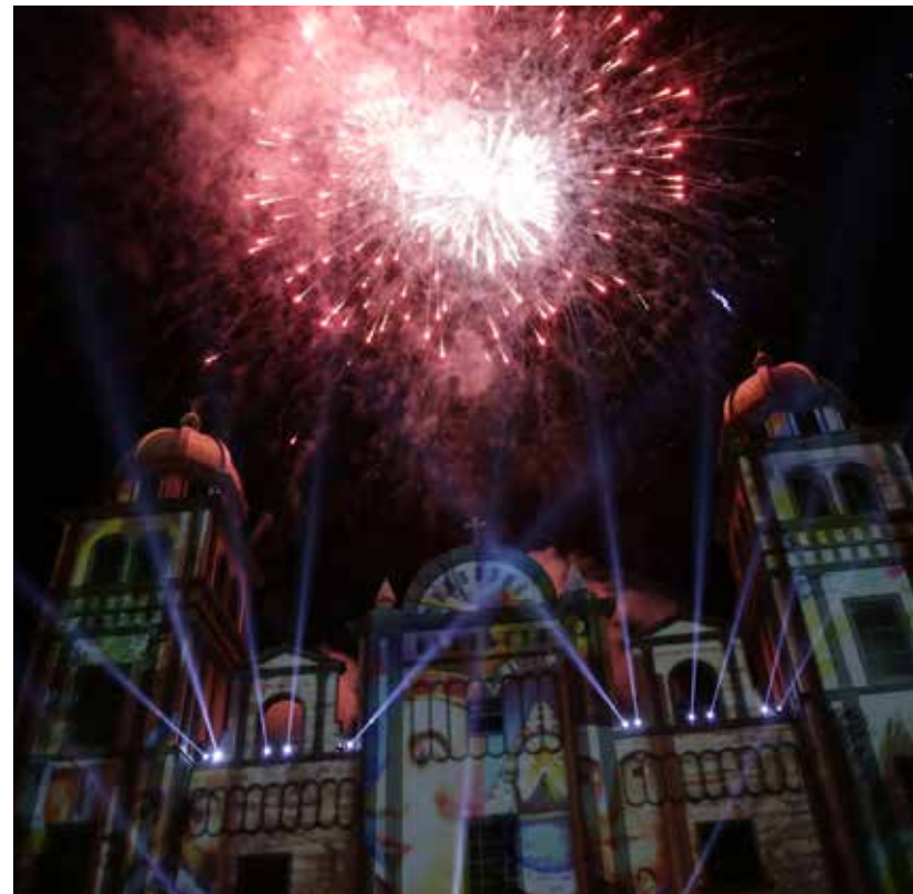
En un evento nunca antes visto en Honduras, un video mapping iluminó el Santuario de Suyapa, donde miles de hondureños disfrutaron de un espectáculo de imágenes que enviaron un mensaje de fe, paz y amor a los hondureños.