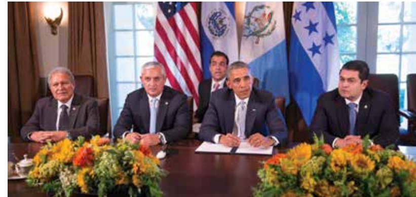
Los presidentes Honduras, Guatemala El Salvador y unieron esfuerzos y se reunieron con el presidente de Estados Unidos, Barack Obama a quien le propusieron el Plan Alianza para la Prosperidad del Triángulo Norte.