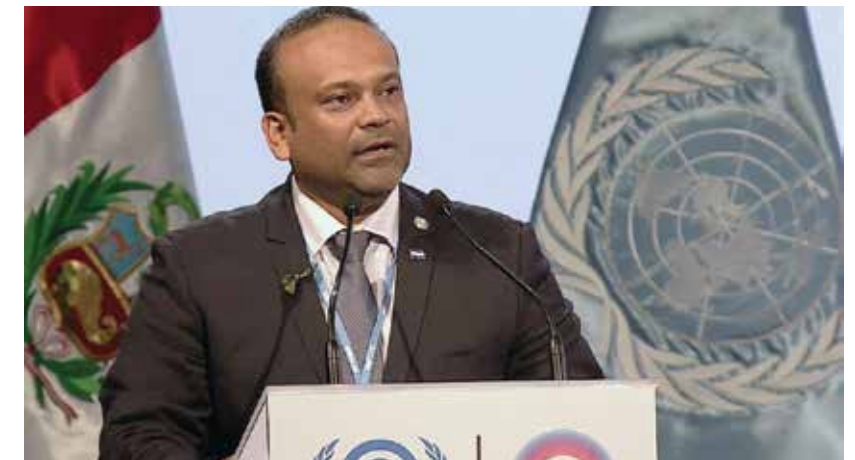
La Secretaría de Recursos Naturales y Ambiente impulsa programas de educación ambiental en las escuelas, proyectos de adaptación al cambio climático entre otras iniciativas para garantizar el uso y cobertura del suelo.