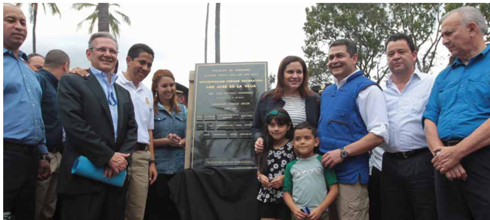
El presidente Hernández y la Fundación Convive Mejor firmaron una Carta de Entendimiento para la construcción y rehabilitación de 20 parques a nivel nacional.