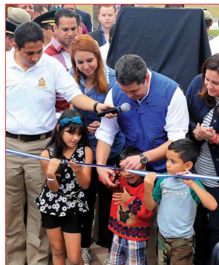
El costo de los 20 parques a nivel nacional es de L 100 millones, el gobierno aportará 60 millones de la Tasa de Seguridad y la empresa privada a través de la Fundación Convive Mejor brindará 40 millones.