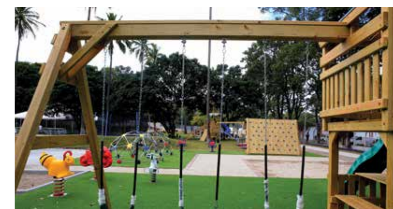
Las instalaciones de los parques tienen columpios y rampas para los más pequeños.