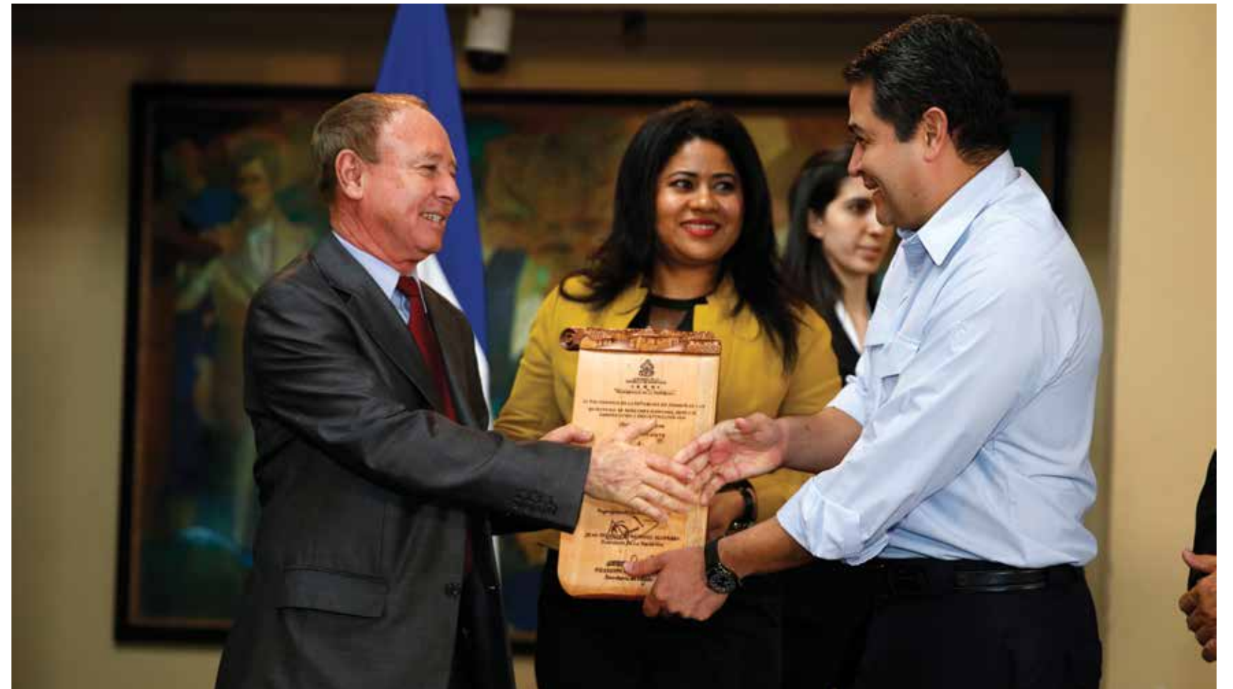
En aras de fortalecer la descentralización de las municipalidades, el Gobierno transfirió más de tres mil millones de Lempiras para la ejecución de proyectos de inversión social, infraestructura entre otras obras que contribuyeron a mejorar la condición de vida de sus pobladores.