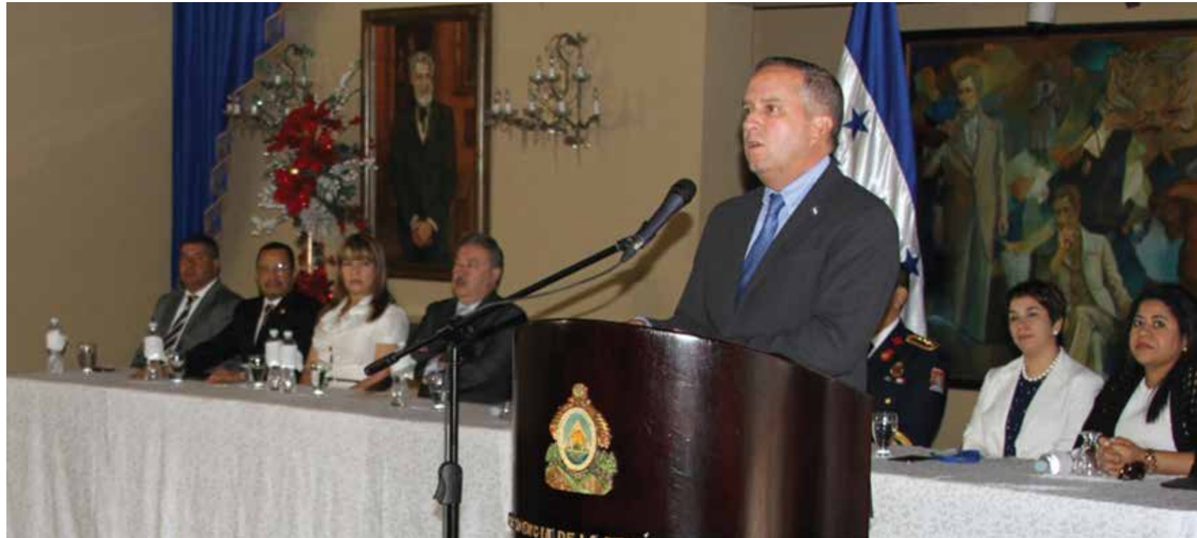
Desde el Gabinete de Gobernabilidad y Descentralización, el Gobierno impulsa una serie de acciones y tratados que contribuyen a la construcción de un país donde todos puedan vivir con libertad e igualdad de condiciones.