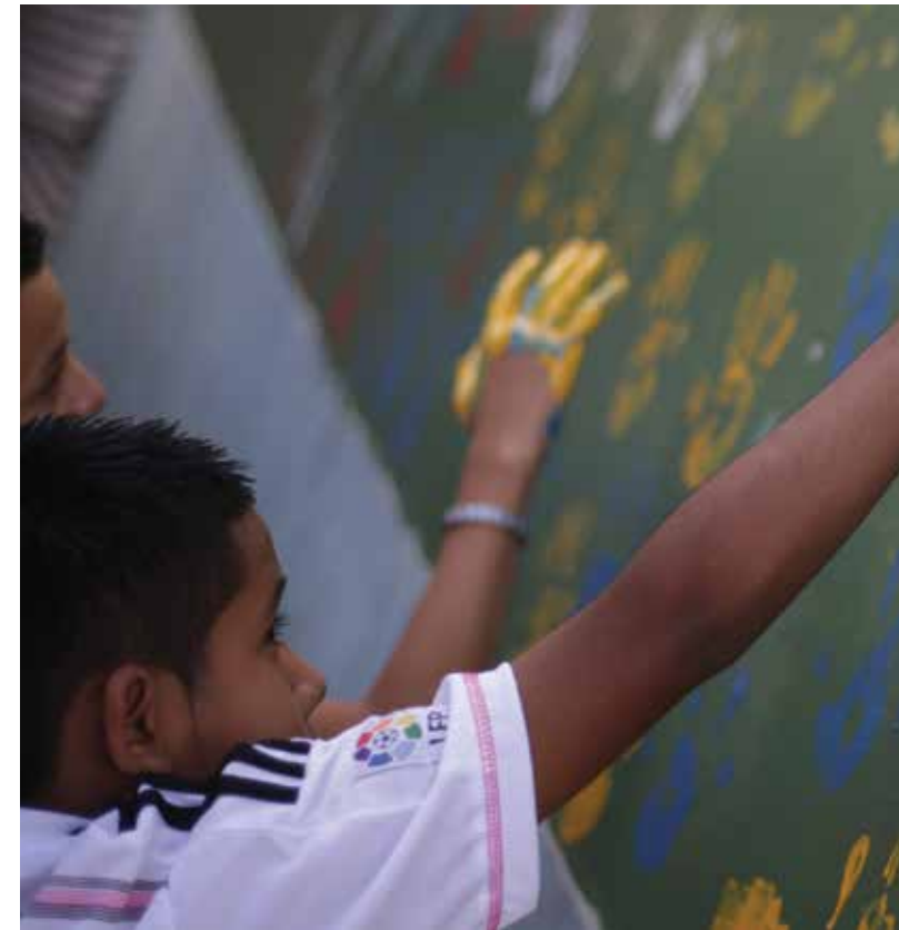
El Gobierno de Honduras conformó la Fuerza de Tarea del Niño Migrante, mediante la cual se inició una estrategia de investigación, información, conocimiento profundo y abordaje integral al fenómeno de los niños migrantes no acompañados procedentes de Honduras hacia los Estados Unidos.