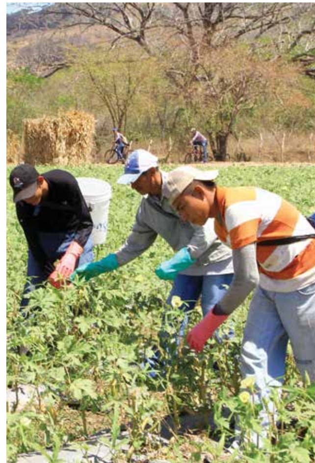
Se logró vencer los episodios de sangre y dolor que anteriormente eran frecuentes en el campo, gracias al diálogo con las organizaciones campesinas, organizaciones de mujeres y comunidades indígenas y afro-hondureñas se recuperó la paz social en las zonas de conflicto agrícola.