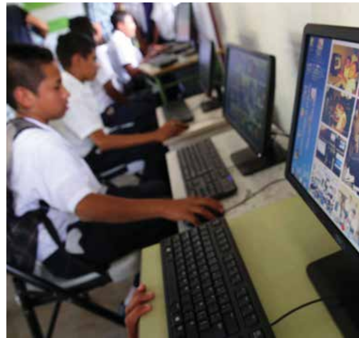
Actualmente 13 parques municipales y 300 escuelas públicas ya cuentan con el Internet gratis en las ciudades de Tegucigalpa. Se espera que en los próximos tres años más de 15 mil centros educativos estén conectados a Internet.