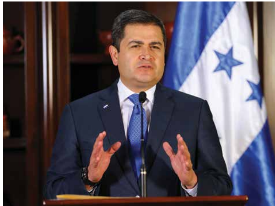
El Presidente Hernández puso en marcha políticas de racionalidad y austeridad que le permitieron disminuir el gasto corriente en tres mil millones de Lempiras.