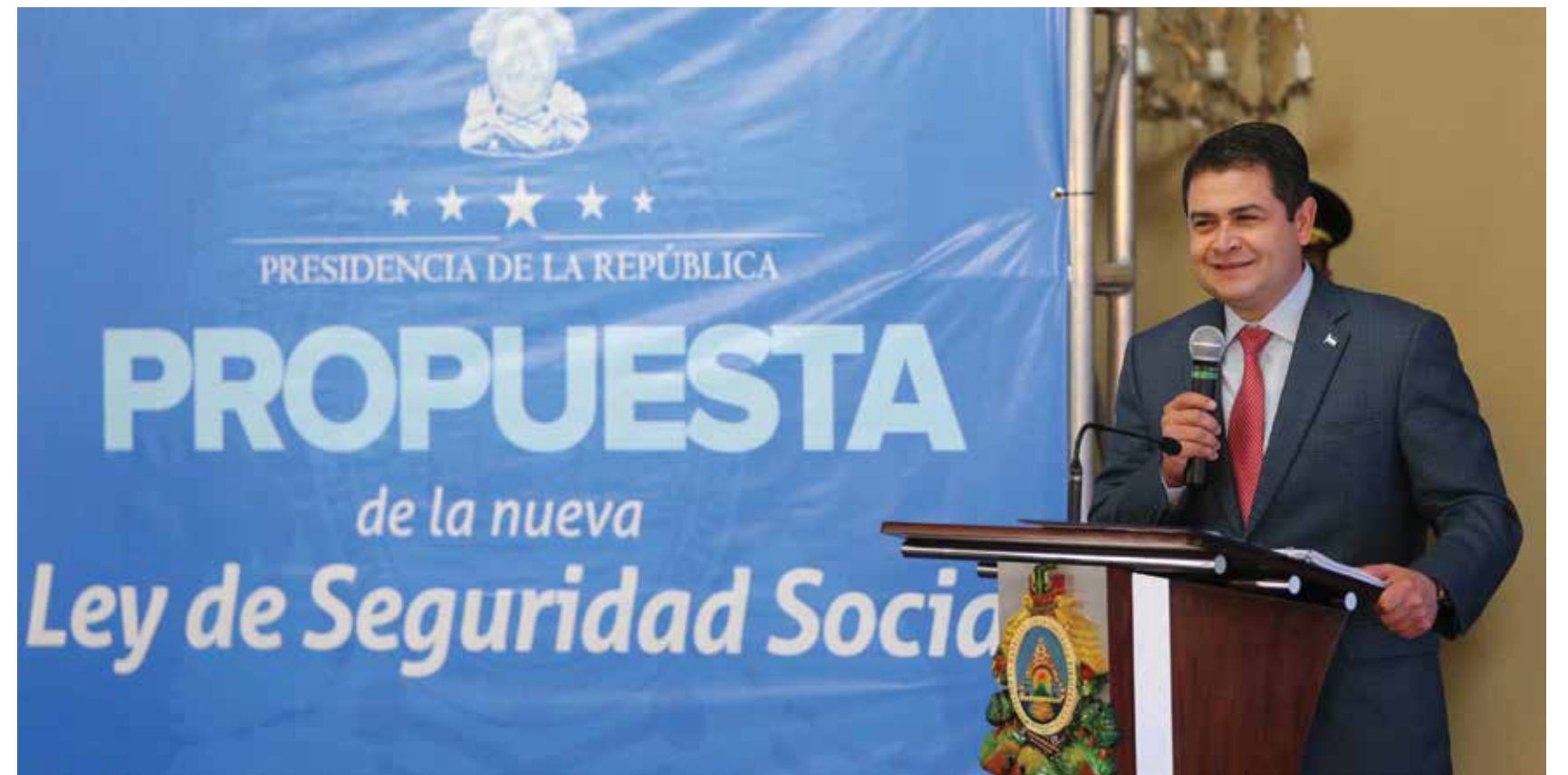
El Presidente Juan Orlando Hernández presentó ante el Congreso Nacional el Nuevo Modelo de Seguridad Social, para que la población hondureña cuente con un sistema universal que garantice ingresos dignos y acceso a servicios de salud con calidad.