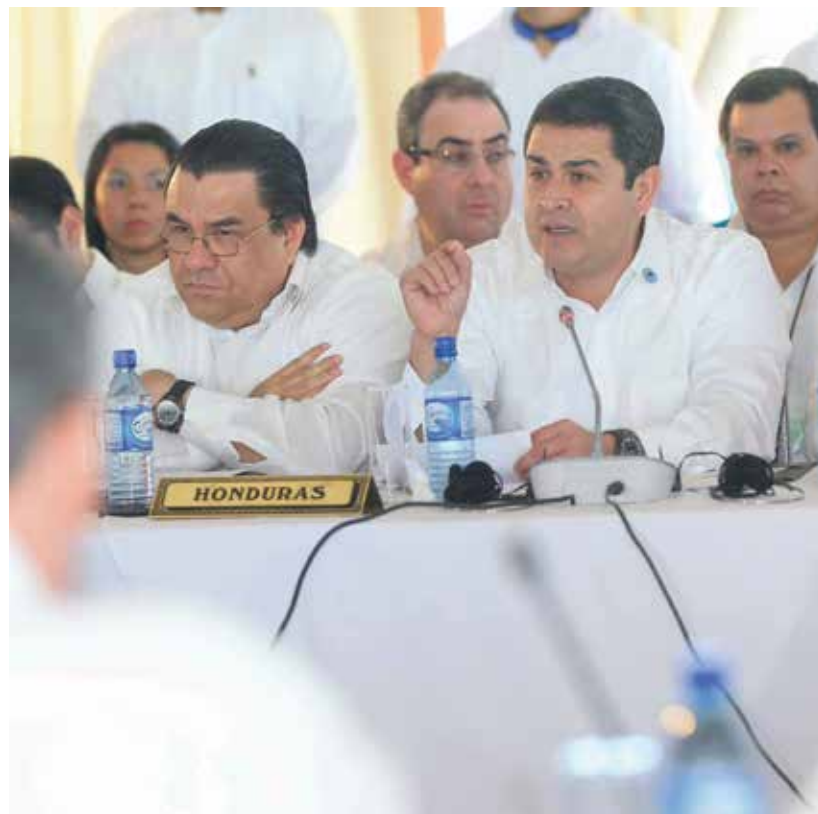
Las alianzas diplomáticas estratégicas que emprendió el Presidente Hernández le permitieron gestionar $516 millones, para los próximos 6 años en cooperación no reembolsable.