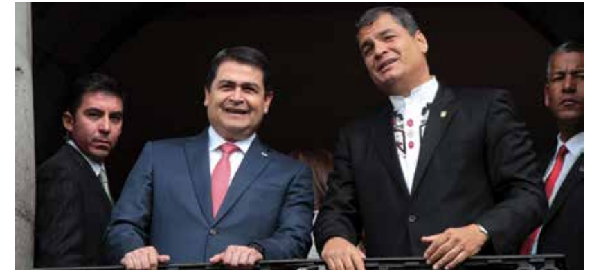
El mandatario hondureño logró normalizar las relaciones diplomáticas con Ecuador y estableció relaciones con otras naciones entre ellas Rusia.