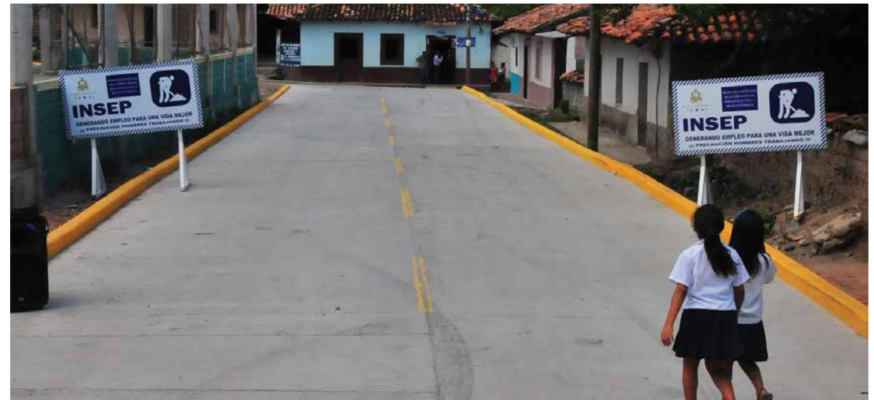
Con el fin primordial de mejorar la calidad de vida de los habitantes e impulsar el desarrollo económico y turístico de los municipios el Presidente Hernández impulsa en las 298 municipalidades el programa "Pavimento Municipal".