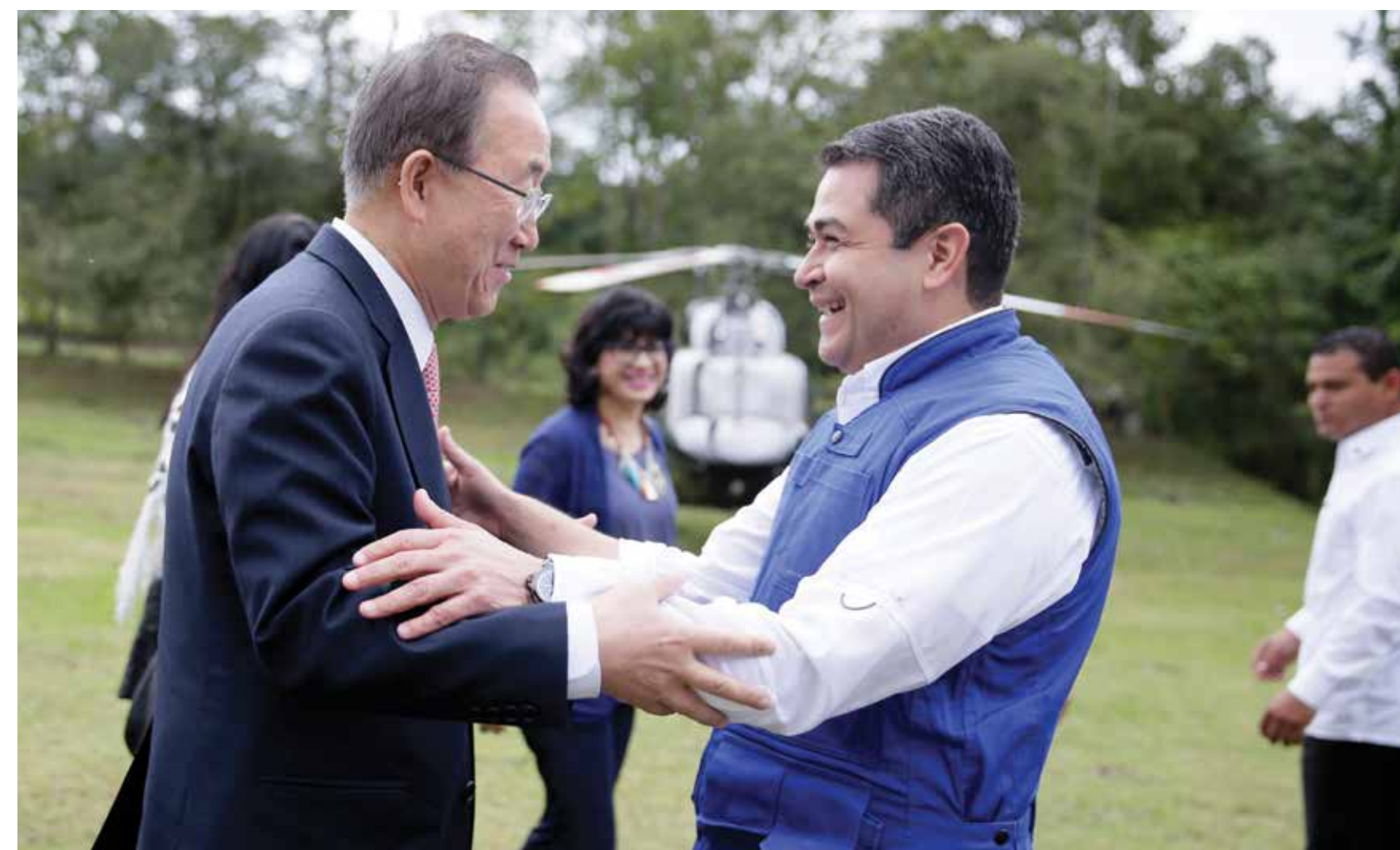
En su visita oficial a Honduras el Secretario General de las Naciones Unidas, Ban Ki-moon felicitó al Presidente Hernández por su fuerte liderazgo y compromiso para proteger la dignidad humana y los derechos humanos, y sobre todo salvar vidas humanas.