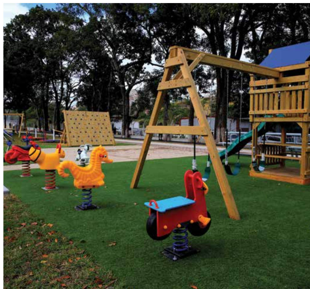
Los parques Por una Vida Mejor cuentan con una diversidad de juegos infantiles.