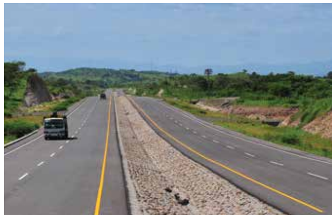
Para recuperar el primer lugar como principal terminal portuaria de la región, se expandió y modernizó la terminal de contenedores y carga de Puerto Cortés.