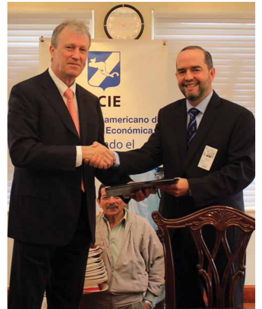
Se firmó el contrato de línea global de crédito con fondos provenientes del Banco Centroamericano de Integración Económica (BCIE) por $ 55 millones.