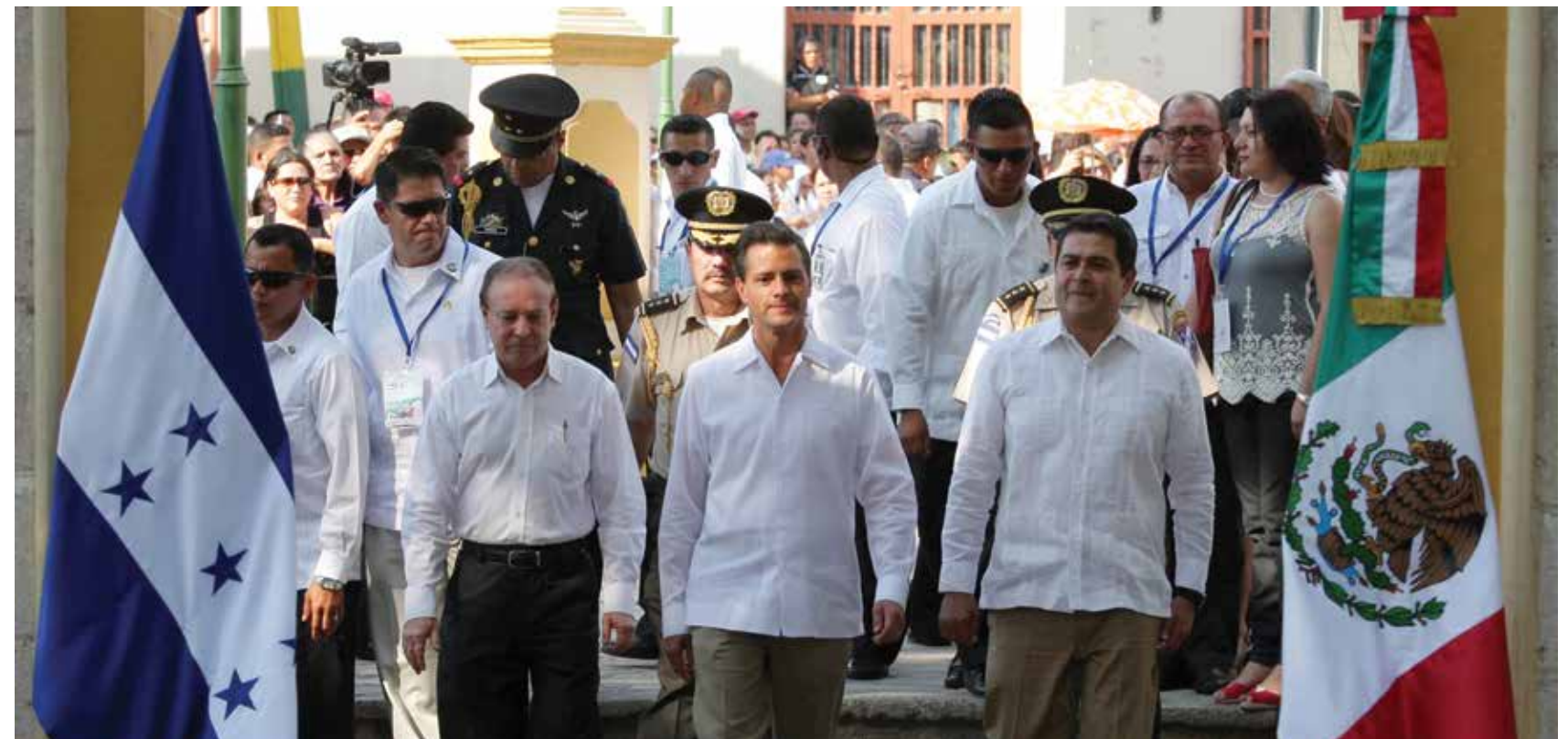
En su primer año de gobierno el presidente Hernández recibió la visita oficial de varios mandatarios entre ellos Enrique Peña Nieto; México, Salvador Sánchez Ceren; El Salvador, Otto Pérez Molina; Guatemala, Luis Solís; Costa Rica y Ma Ying-jeou; República de China Taiwán.