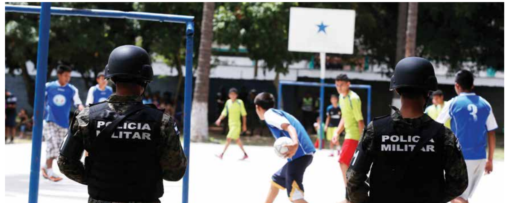
Para garantizar la seguridad de los hondureños, las Recreovías, Parques Por una Vida cuentan con la vigilancia permanente de la Policía Militar.