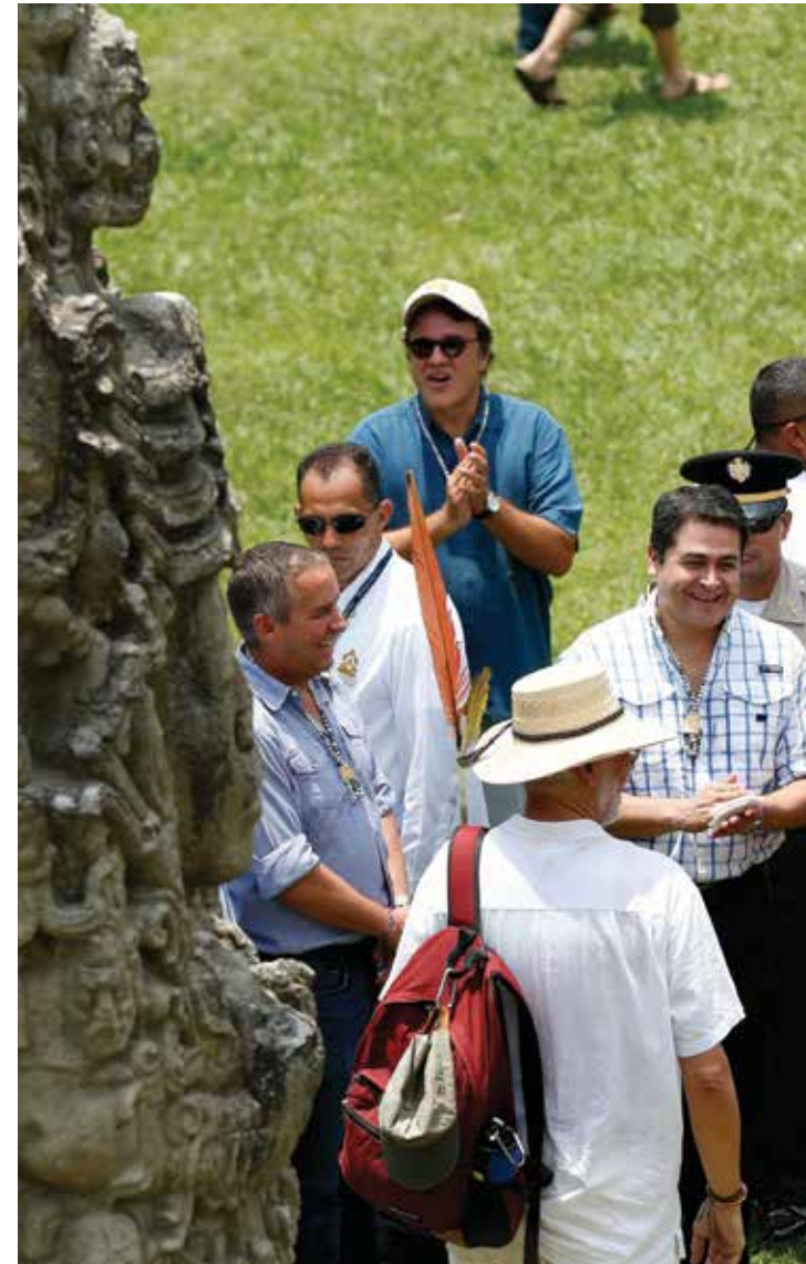
El Presidente Juan Orlando Hernández trabaja en la base de lo que será la Marca País-Honduras, este impulso cuenta con el apoyo de la empresa privada que se unió a los esfuerzos estatales para fomentar la competitividad nacional y posicionar el país a nivel internacional como destino para la inversión y para el turismo.