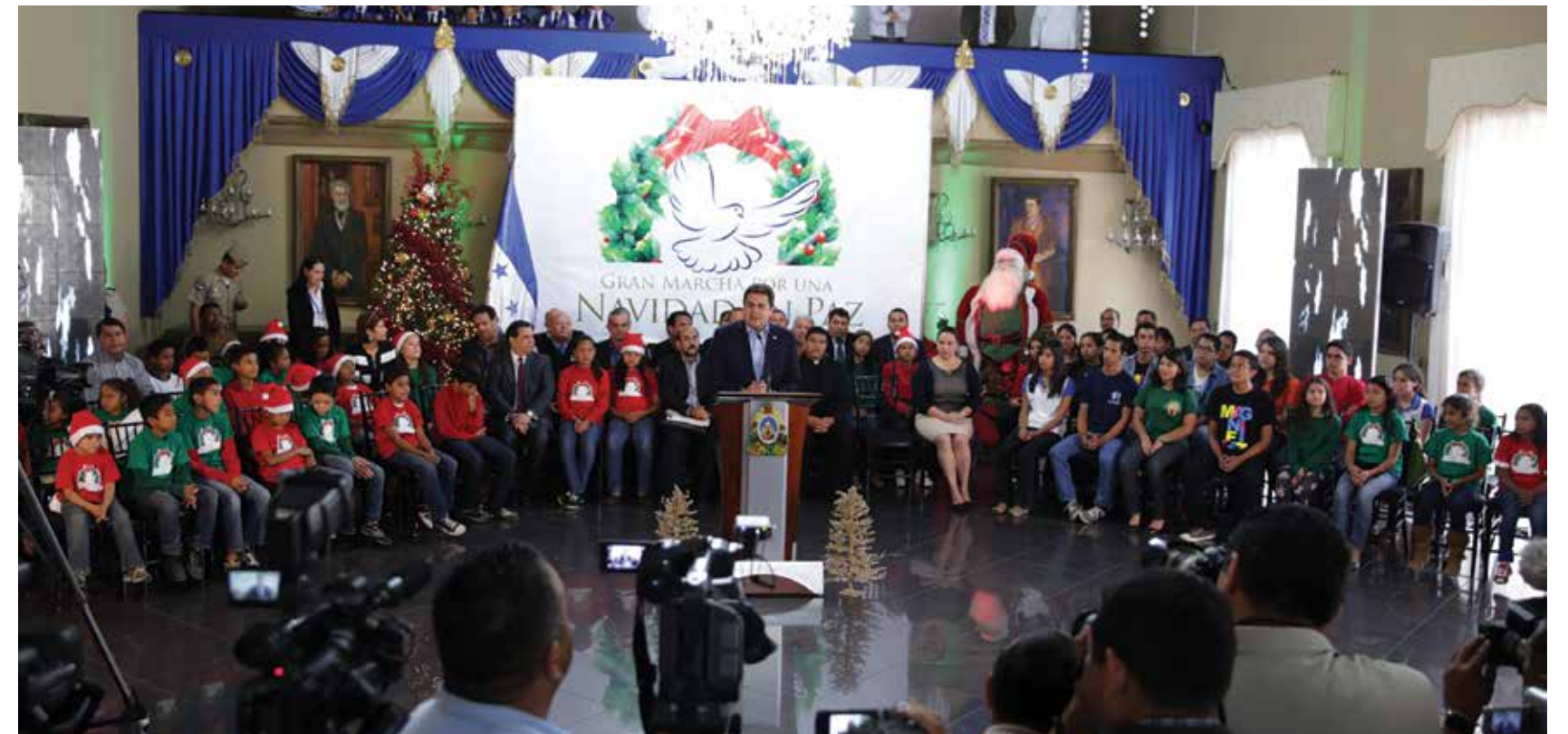
Miles de niños, padres de familia y abuelos participan todos los fines de semana en las Recreovías por una Vida mejor, una iniciativa del mandatario hondureño para devolverle los espacios públicos a los hondureños.