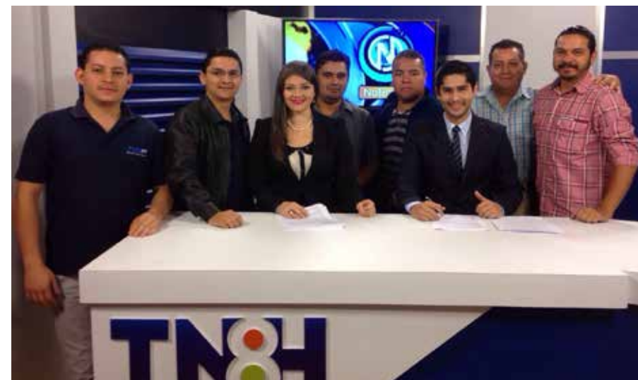
Uno de los propósitos fundamentales de la Secretaría de Estrategia y Comunicaciones es fortalecer los medios de comunicación del Estado para que sean un referente en la información nacional.