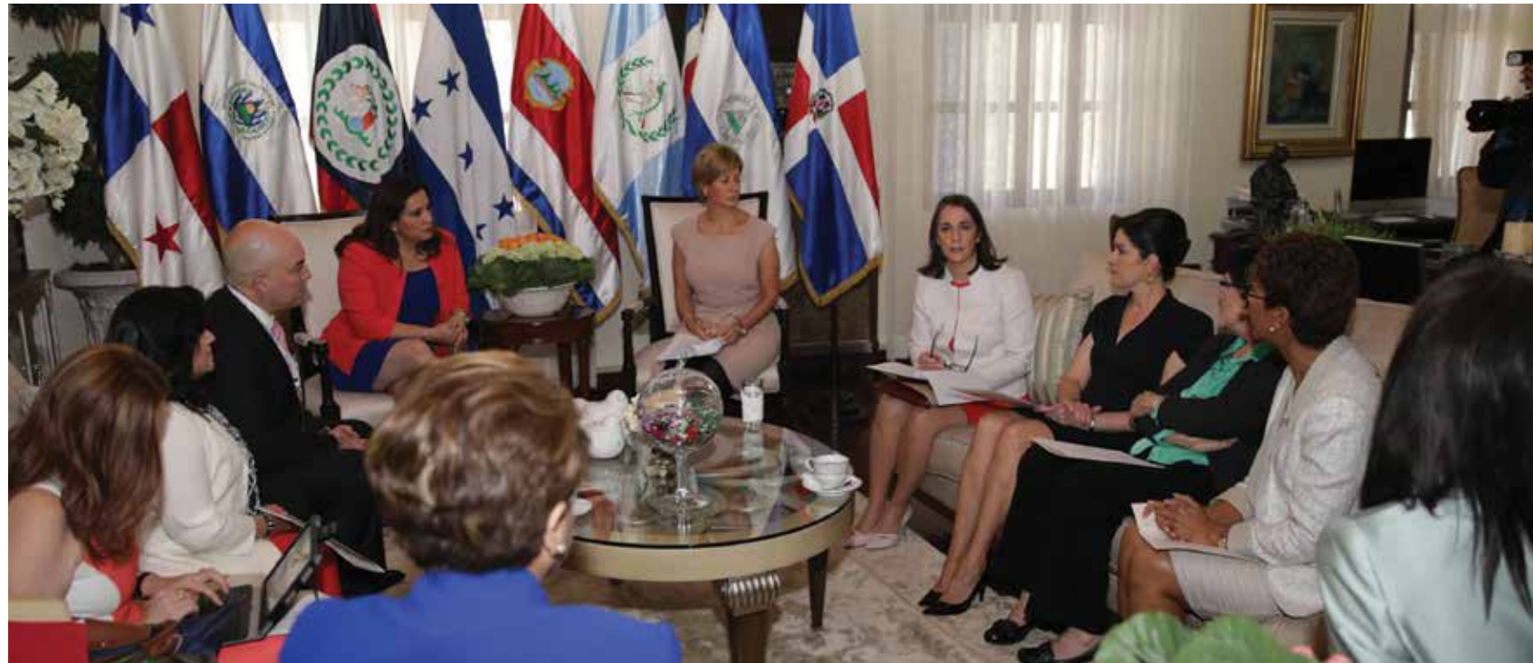
Para reducir los índices de adolescentes embarazadas la Primera Dama lanzó el “Plan Intersectorial de Prevención de Embarazos en Adolescentes” y organizó la Cumbre de Primeras Damas a fin de generar conciencia sobre esta problemática en la región.