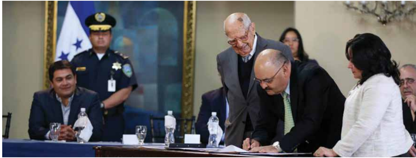
Con el objetivo de acabar con la corrupción que manchaba las licitaciones en la Secretaría de Salud, el Presidente Hernández implementó un fideicomiso con la banca privada y organismos internacionales que transparenta la compra de medicamentos e insumos médicos.