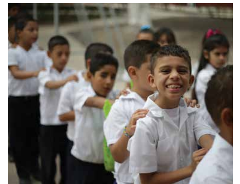
Gracias al ahorro en el gasto público se ha podido destinar mayores recursos a programas sociales, como aquellos de protección de la niñez.