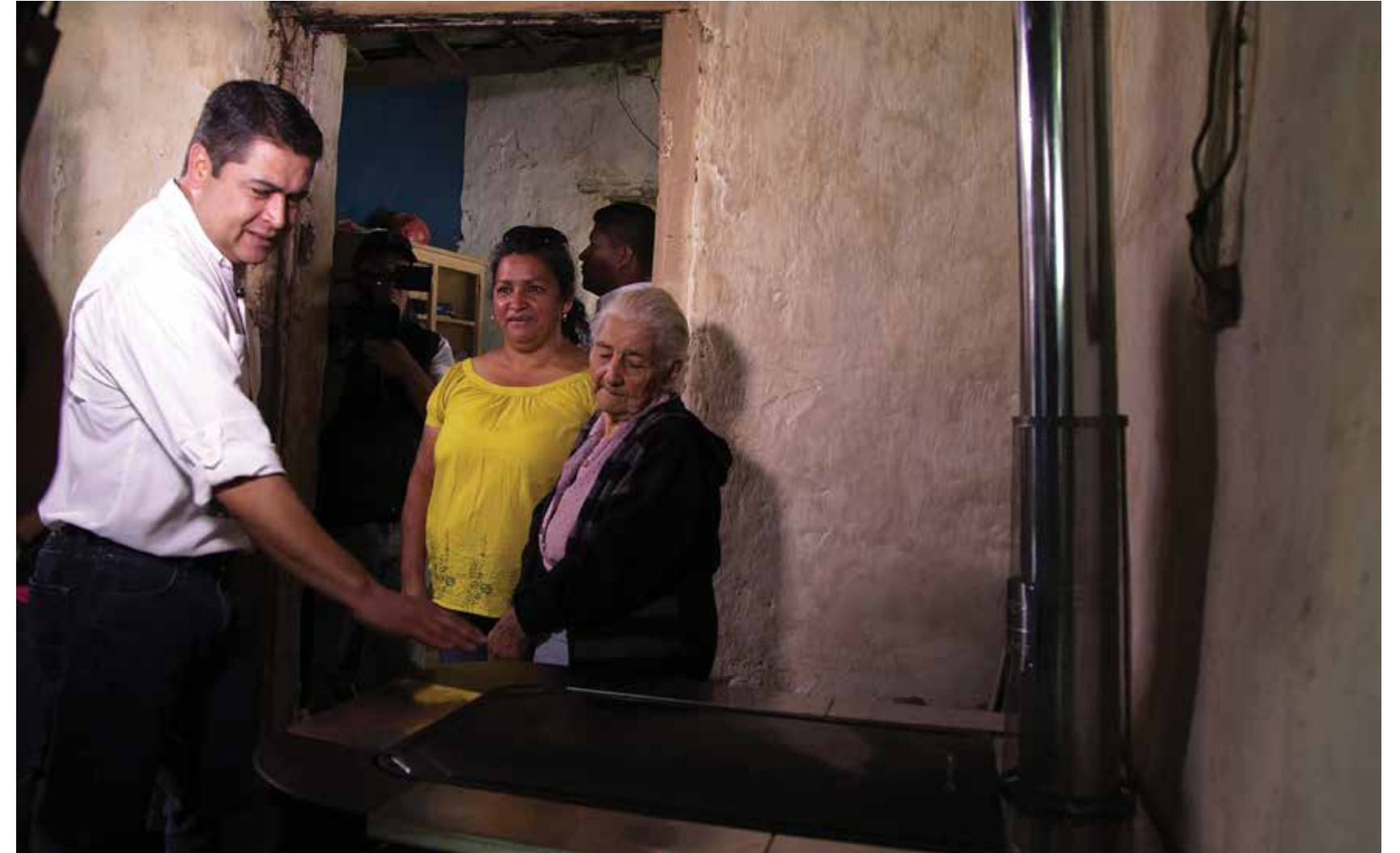
Más de 530 mil familias fueron beneficiadas con viviendas, techos, suelos, eco fogones, filtros de agua, subsidios y otros programas sociales.