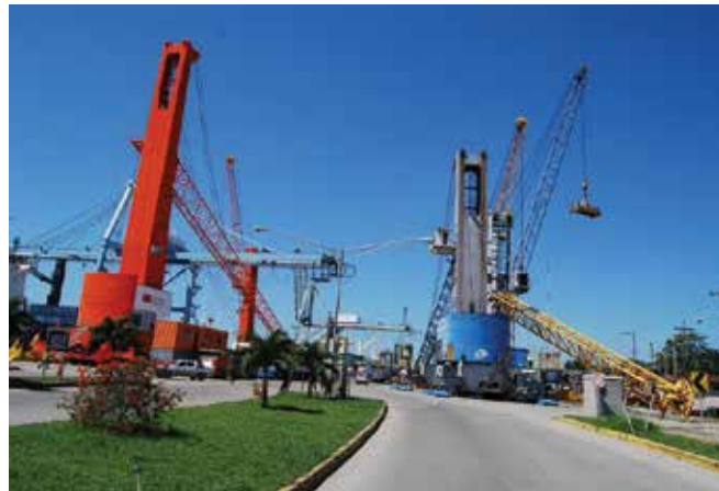
Se expandió y modernizó la terminal de contenedores y carga general de Puerto Cortés, para recuperar el primer lugar como principal terminal portuaria de la región.