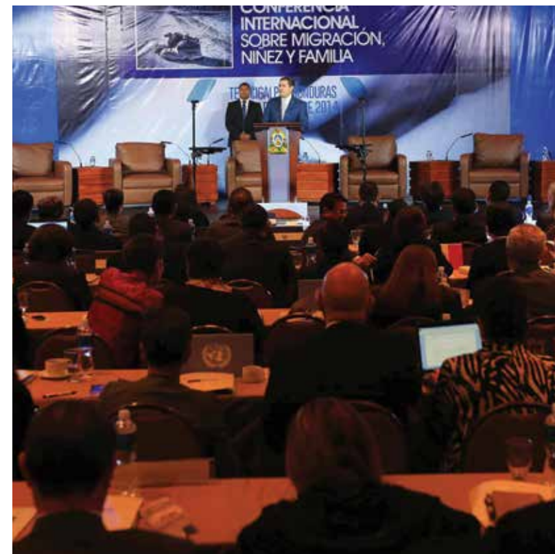
Honduras organizó la Conferencia Internacional sobre Migración, Niñez y Familia mediante la cual expositores internacionales examinaron la crisis humanitaria y sus consecuencias, analizando las causas de su origen y las posibles soluciones a la situación.