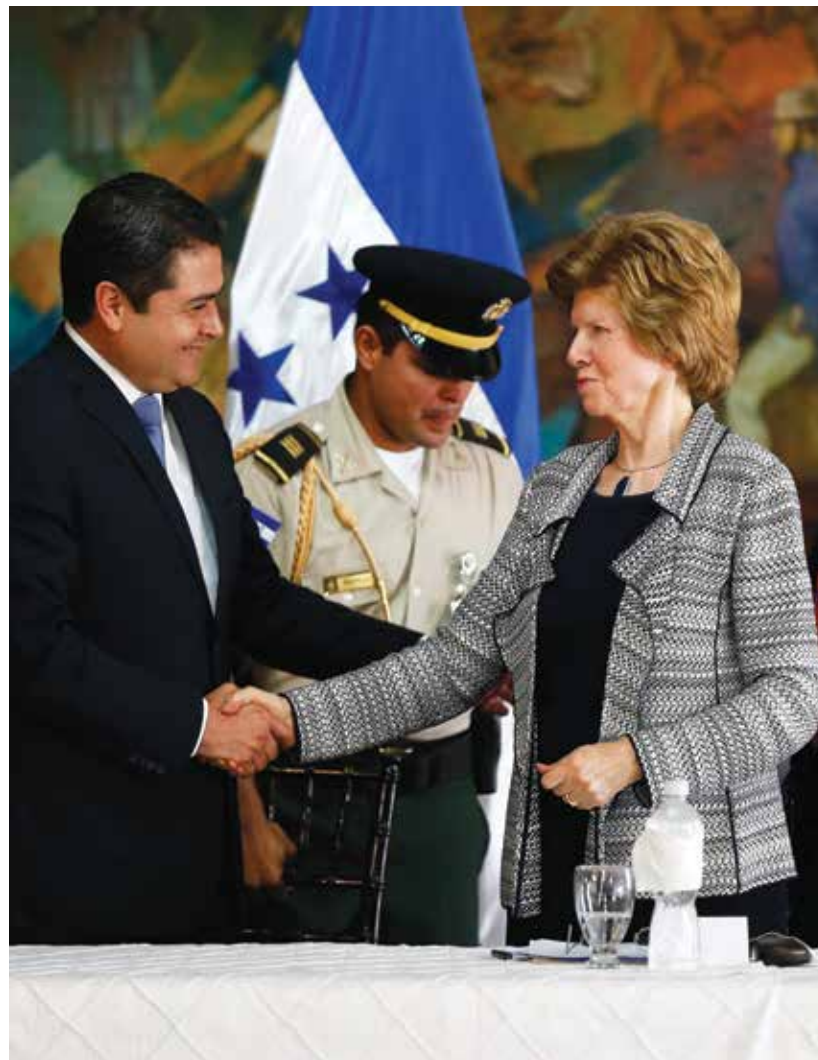
Honduras es el primer país en el mundo en firmar un convenio con Transparencia Internacional, lo que demuestra el firme compromiso del gobierno para fomentar y promocionar la transparencia.