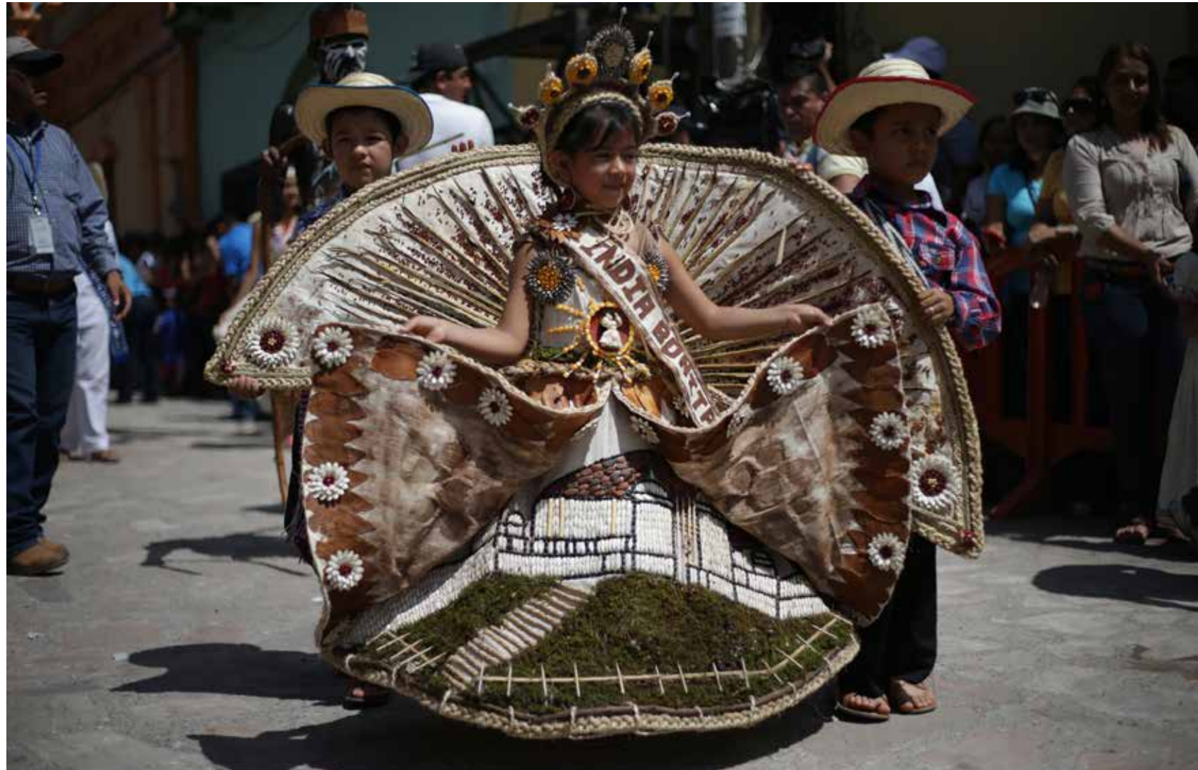
El Presidente Hernández realiza una serie de eventos para fortalecer el orgullo de los hondureños por su país.