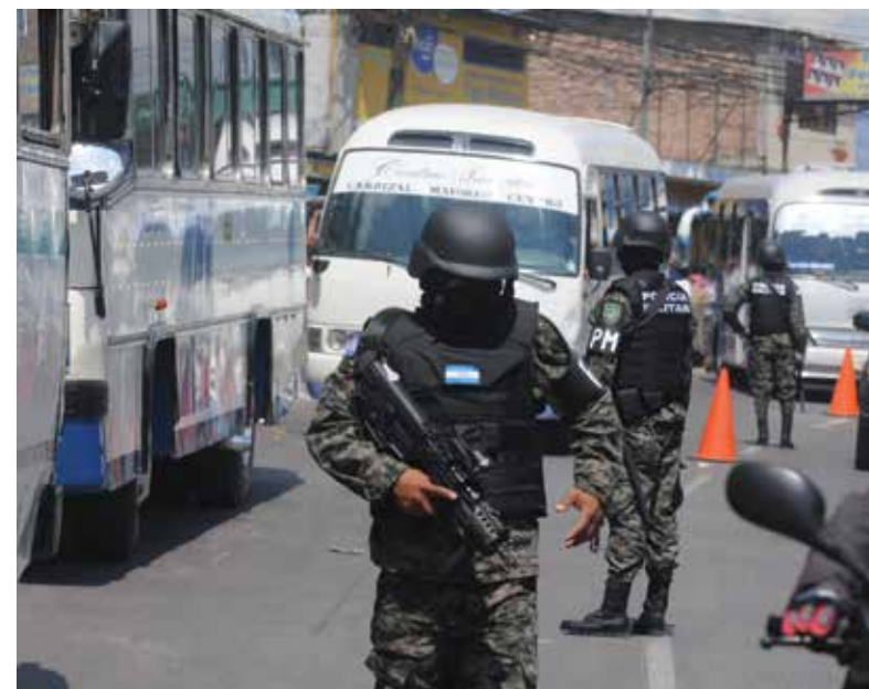
Los cuerpos de seguridad en las calles han devuelto la paz y tranquilidad a zonas que anteriormente se caracterizaban por sus altos índices de violencia.

El combate a la delincuencia y la criminalidad no sería posible sin el esfuerzo combinado de las diferentes instituciones del Estado, organizaciones civiles, iglesias y gobiernos locales que deben seguir uniendo esfuerzos por devolverles la tranquilidad a los hondureños. La decisión inquebrantable del gobernante hondureño es piedra angular en esta faena que ha empezado con pie derecho y en la que hay una ruta larga por recorrer pero en la que la muestra de que Honduras está cambiando son palpables.