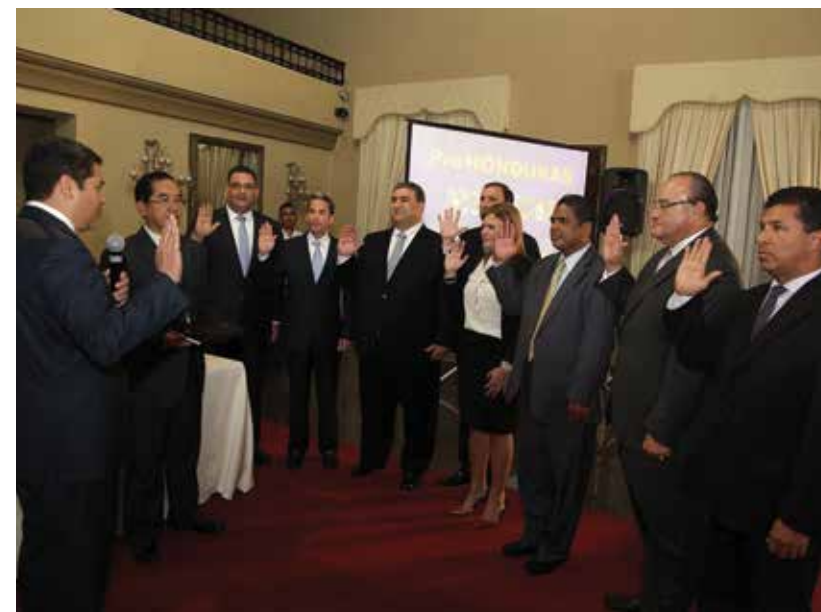
El Presidente Hernández creó el Consejo Nacional de Inversiones, con el propósito de diseñar una estrategia y plan de inversiones en el país.