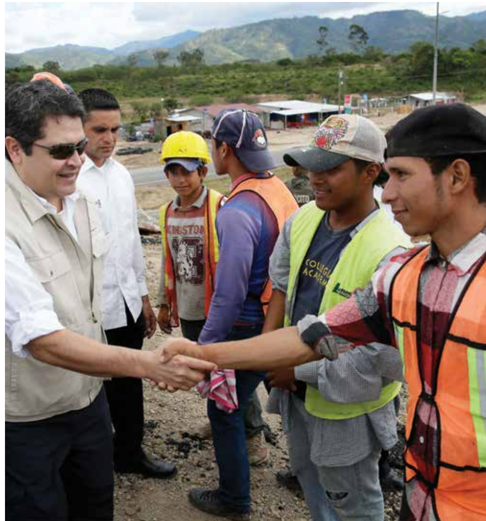
Los proyectos viales además de modernizar la infraestructura del país son una fuente generadora de empleo a nivel nacional