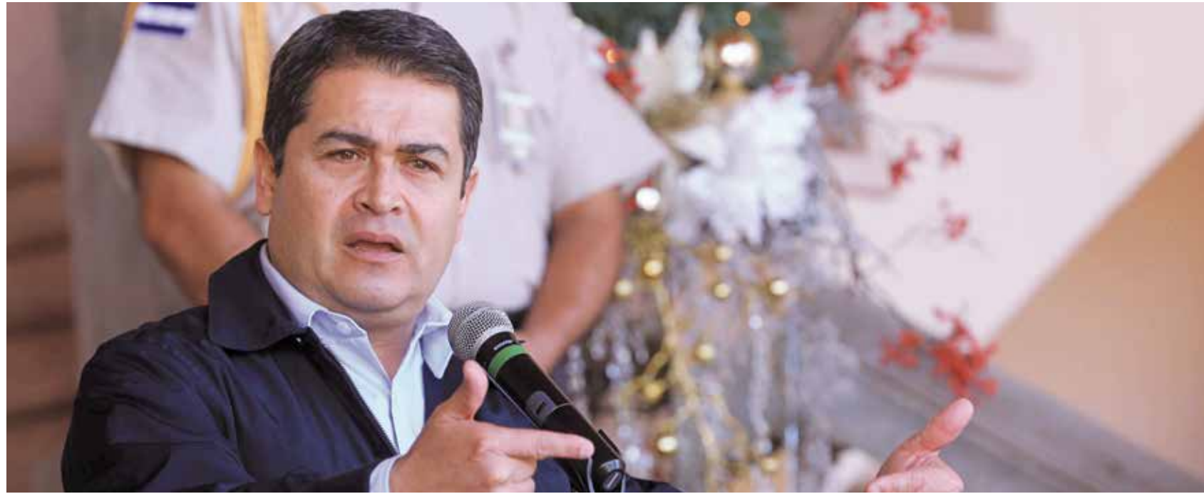
Marcando un rumbo de transparencia en el aparato estatal, el Presidente Hernández ordenó la intervención del Instituto Hondureño de Seguridad Social, la Dirección Ejecutiva de Ingresos y el Instituto Nacional de Jubilaciones y Pensiones de los Empleados Públicos, Injuemp.