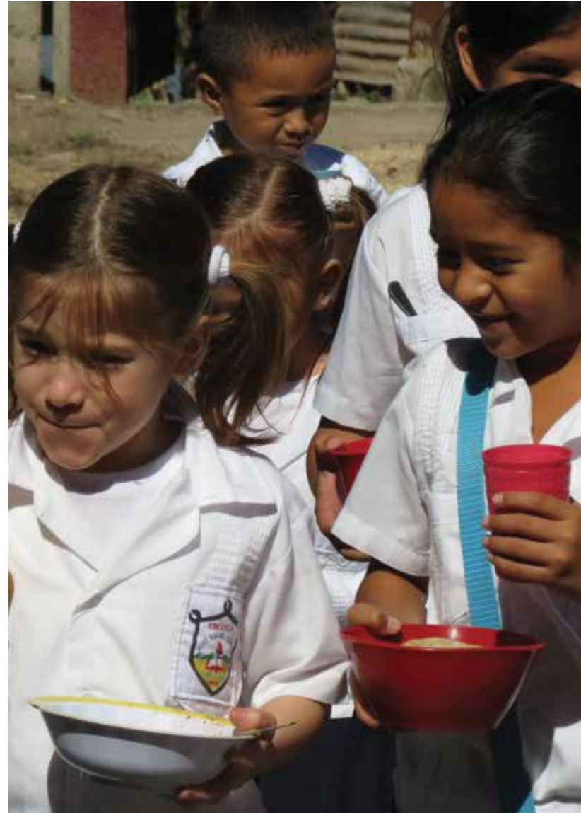
La Merienda Escolar llegó a 1.2 millones de niños, el propósito del Presidente Hernández es fomentar un esquema balanceado de alimentación.