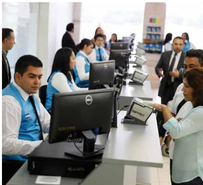
El Gobierno recobró la seguridad de los aeropuertos y reforzó los controles en todas las aduanas del país. Además implementó un nuevo modelo de Seguridad Aeroportuaria que garantiza un control eficaz y seguro de las personas que entran y salen de Honduras.