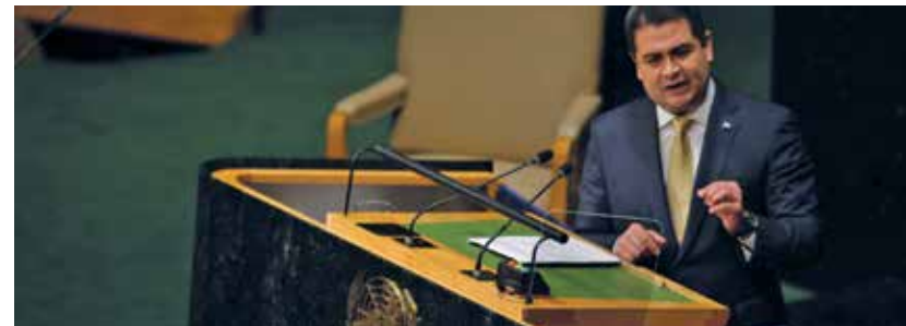
El Presidente Hernández tuvo una destacada participación en foros Multilaterales, entre los que destacan los logros obtenidos en la 69 Asamblea General de las Naciones Unidas, donde exigió que la crisis migratoria fuera vista como un tema de responsabilidad compartida.