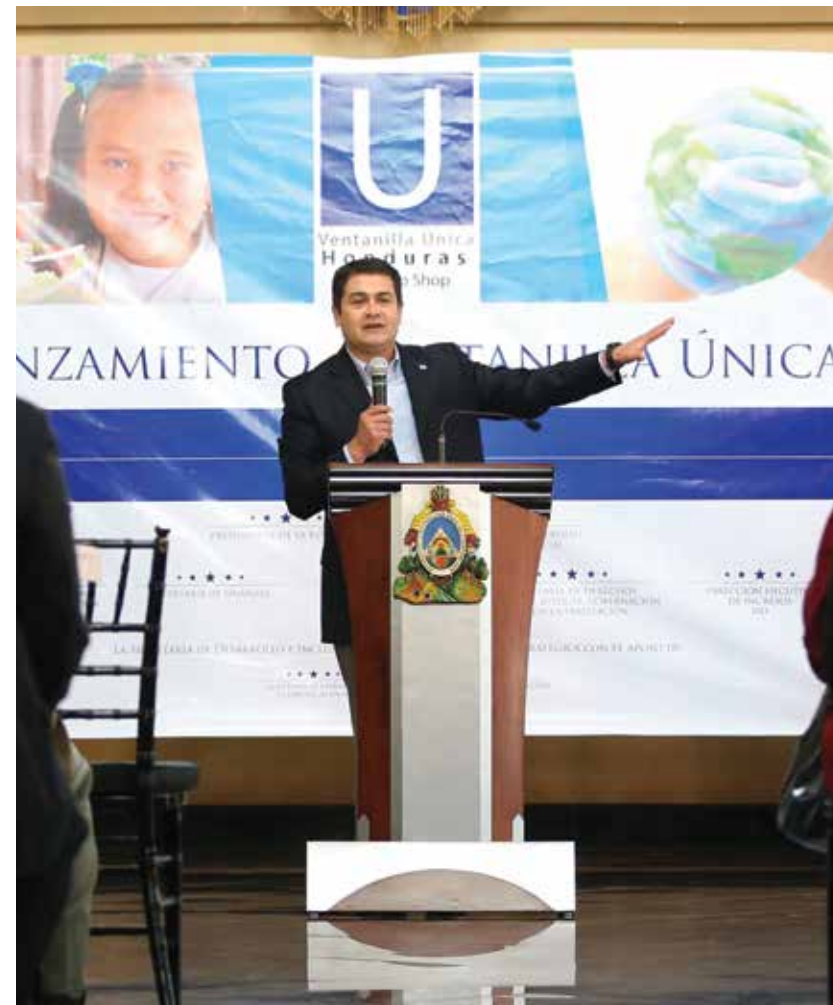
El Presidente Juan Orlando Hernández puso en marcha el nuevo sistema de Ventanilla Única web que permitirá agilidad y transparencia para garantizar captación y ayuda humanitaria que llegue al país.