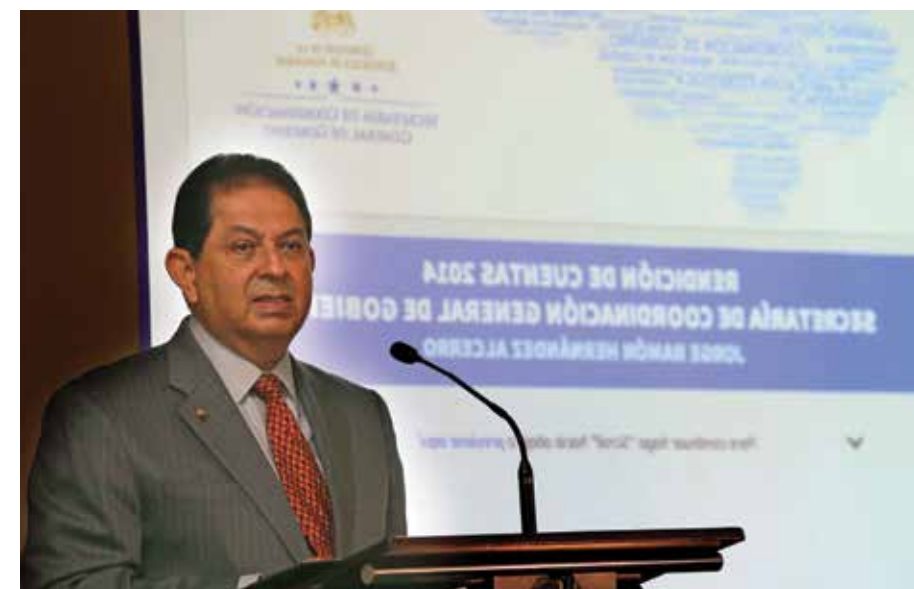
La nueva plataforma de Gestión por Resultados que supervisa la Secretaría de Coordinación General garantiza un gobierno eficiente, competitivo y transparente que presta mejores servicios a sus ciudadanos.