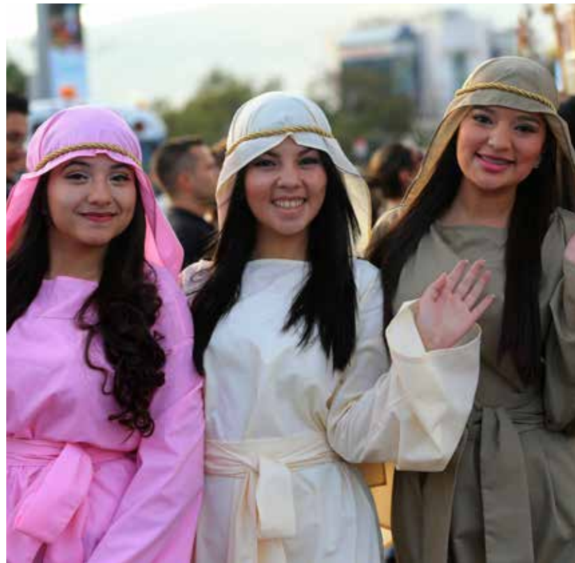
En el marco de la Navidad Catracha las instituciones de Gobierno organizaron un colorido desfile de carrozas y bandas musicales que exaltó los valores morales y familiares.