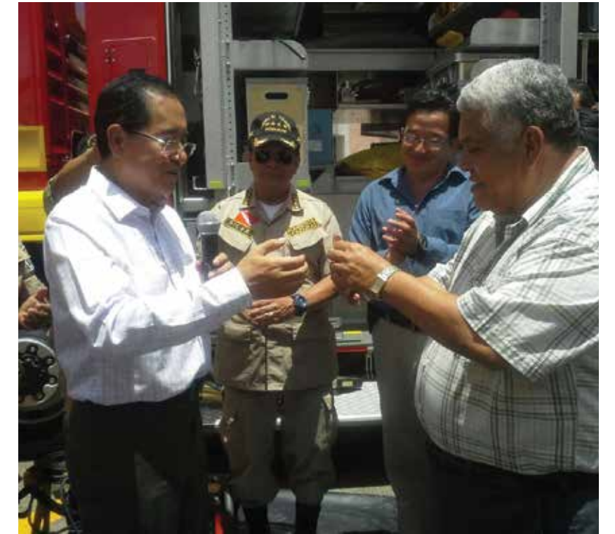
La entrega de nuevas unidades contra incendios al Cuerpo de Bomberos, fueron parte del apoyo que el Presidente de la República, Juan Orlando Hernández, realizó durante el 2014.