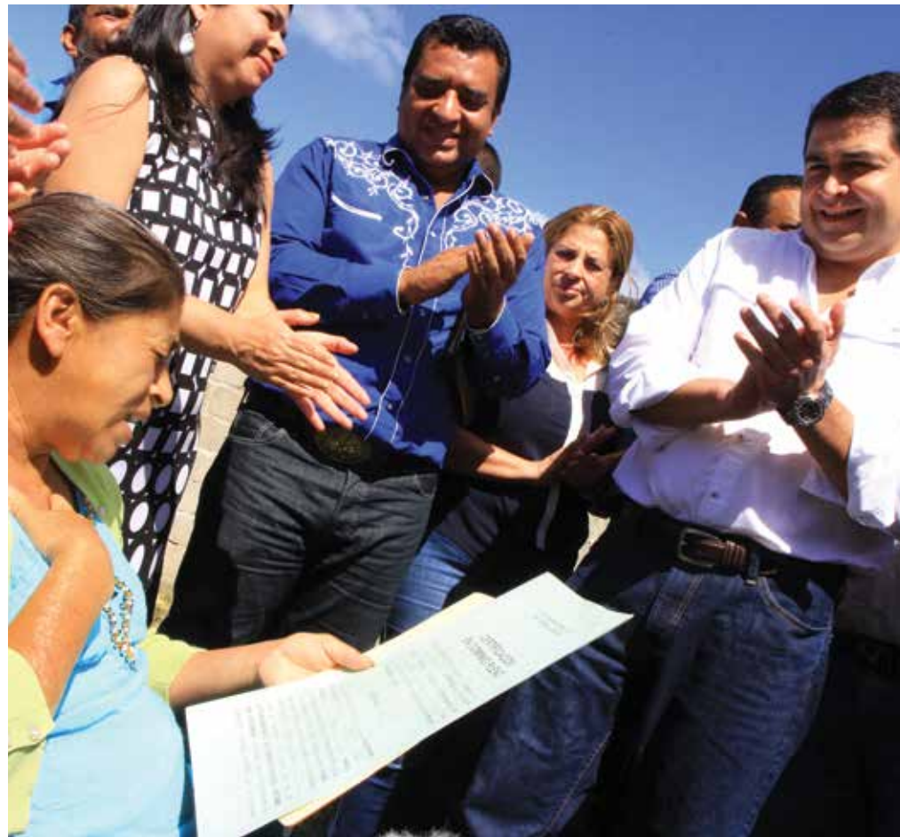
Hoy más de 60 mil personas cumplieron su sueño de tener su título de propiedad, esto les da la seguridad de poder heredarles un patrimonio a sus hijos.