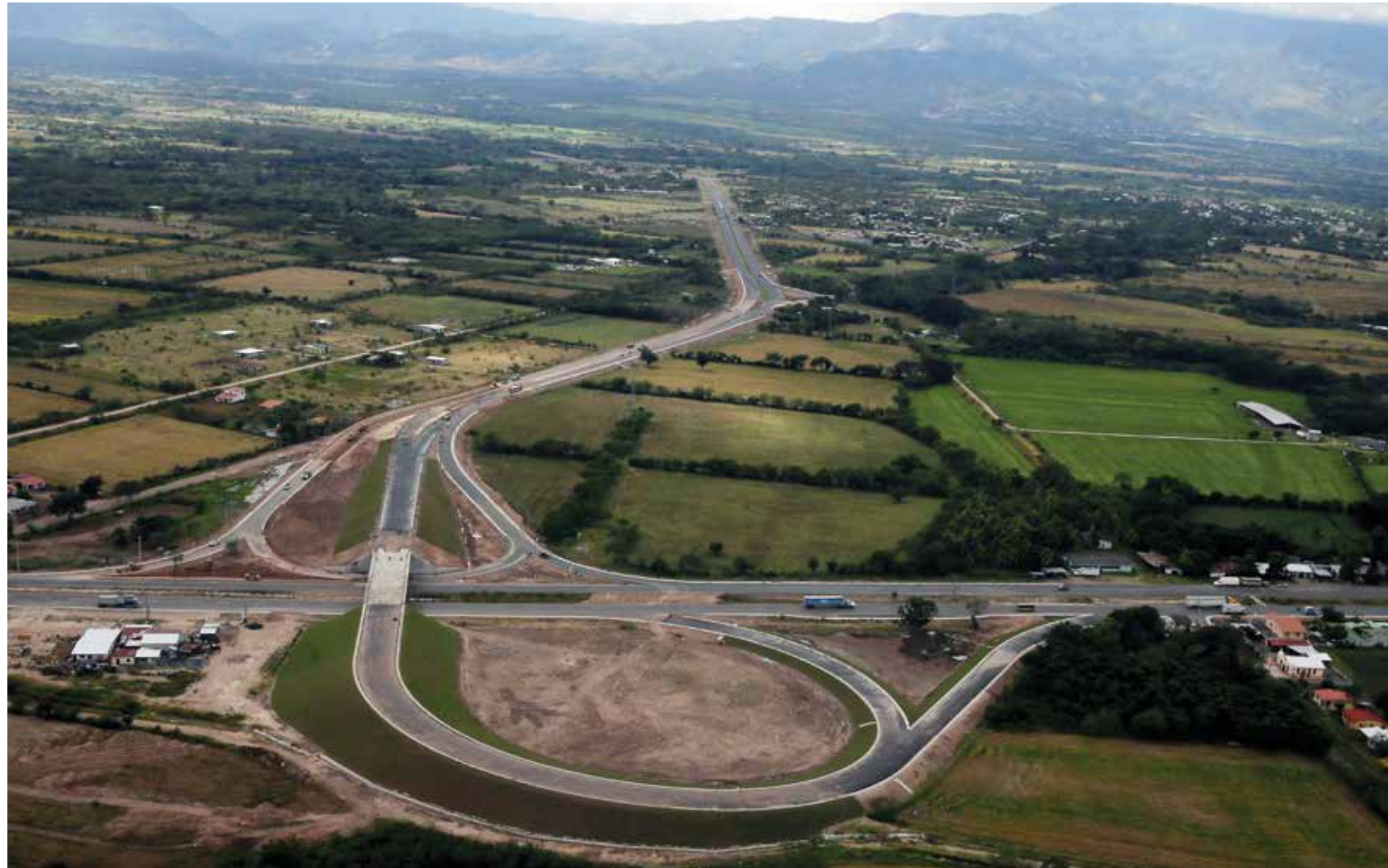
El acuerdo con el Fondo Monetario Internacional permite que el pueblo hondureño pueda acceder a USD460 millones que serán invertidos en la culminación del Canal Seco, construcción del Puerto de Amapala, ejecución de programas sociales en beneficio de los más pobres y el saneamiento de las empresas estatales.