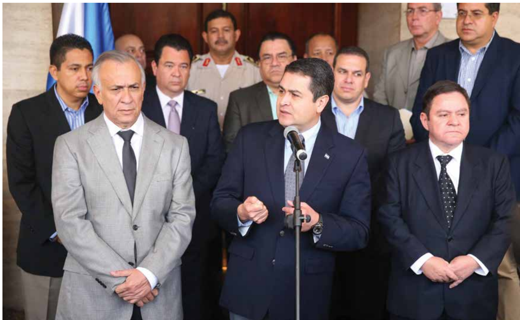
El Presidente Hernández comenzó la lucha contra el crimen articulando las fuerzas de orden público en Consejo Nacional de Defensa y Seguridad.