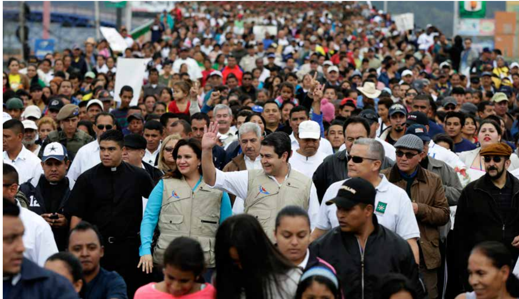
Las celebraciones navideñas comenzaron con la Gran Marcha por una Navidad en Paz que contó con la participación de más de 50 mil personas.