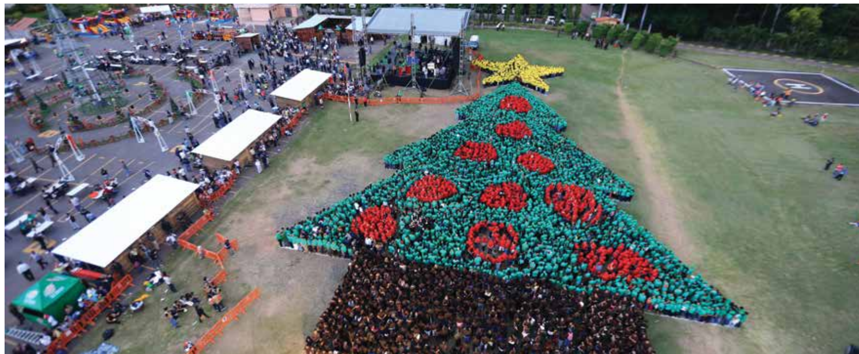
Honduras rompió el Record Guinness al conformar el Árbol de Navidad Humano más grande del mundo.