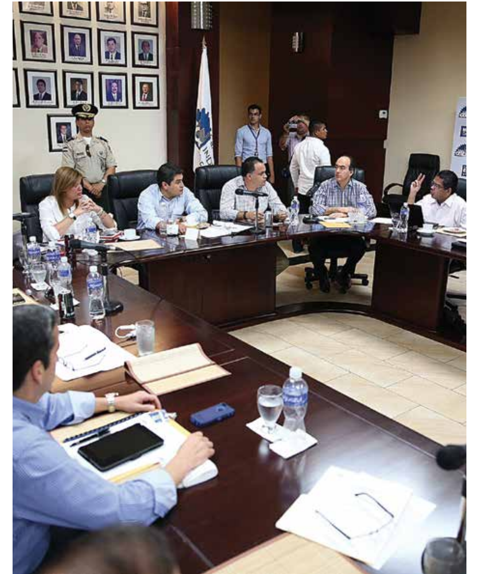
La estrategia Marca País- Honduras, cuenta con la participación del Consejo Nacional de Inversiones y del Ministerio de Estrategia y Comunicación.