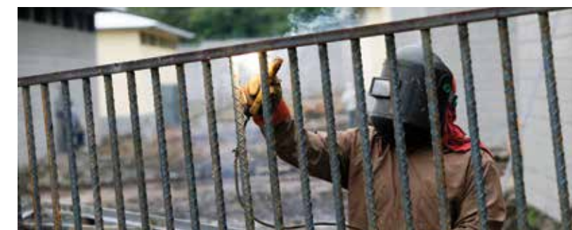
El Presidente Hernández aprobó la construcción de cinco nuevos centros penitenciarios en diferentes puntos del país.