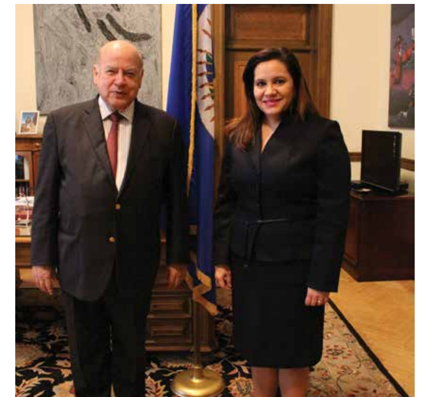
La Primera Dama de Honduras, Ana de Hernández, recibió un reconocimiento del secretario general de la OEA, José Miguel Insulza y del secretario adjunto, Albert Ramdin.