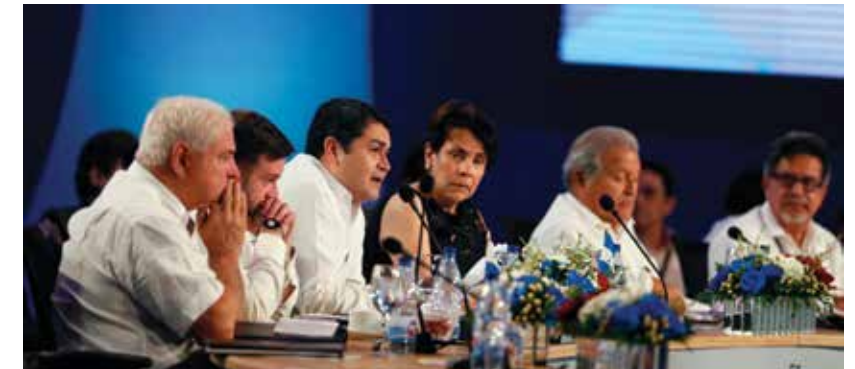
El Presidente Hernández tuvo una participación destacada en las Cumbres del Sistema de Integración Centroamericana, SICA, Iberoamericanas y de Negocios que se llevaron a cabo en el 2014.