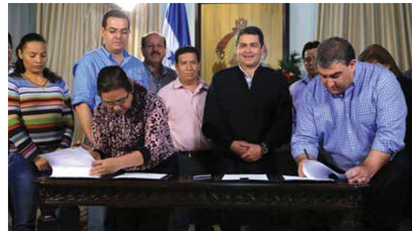
Por primera en la historia de Centroamérica, Honduras logra un acuerdo de incremento salarial para los empleados del sector maquilador por un periodo de cuatro años. La negociación también implica que los trabajadores tengan acceso a los programas sociales y cuotas blandas para la adquisición de viviendas.