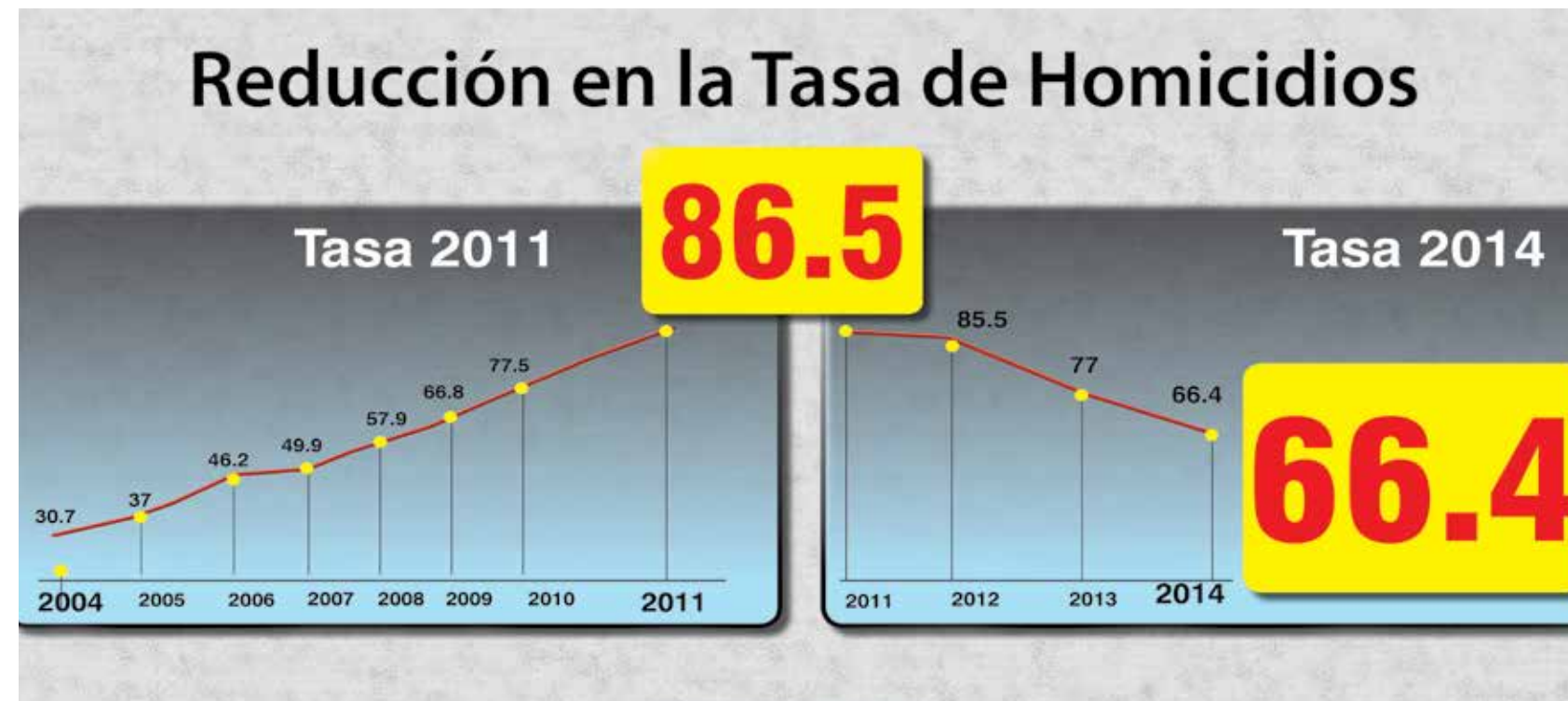
Las acciones por recobrar la paz permitieron una reducción en las cifras de homicidios, en el 2014 las muertes violentas pasaron de 86 a 66 por cada cien mil habitantes.