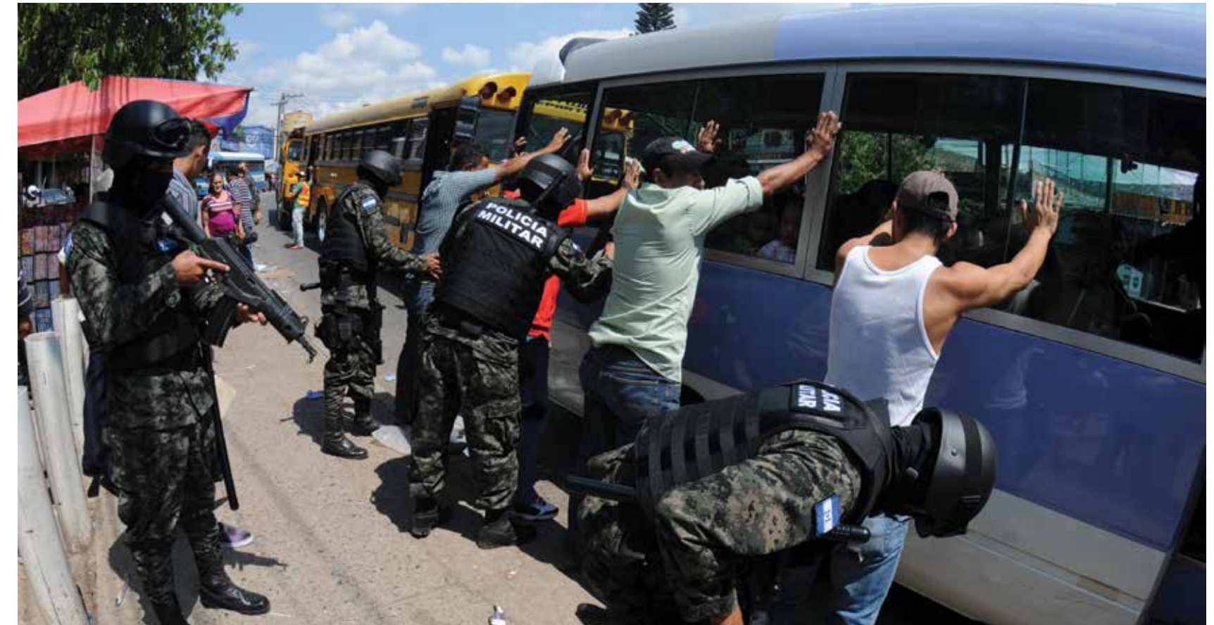
Los operativos liderados por la Policía Militar a nivel nacional dejaron como resultado la desarticulación de bandas de narcotraficantes, secuestradores, extorsionadores, desmantelamiento de casa locas y captura de líderes de maras.