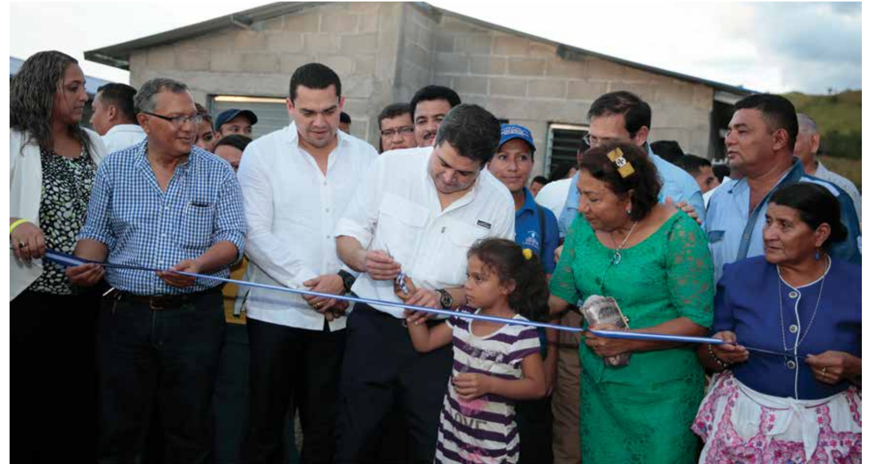
Las familias más pobres de Honduras ya tienen la posibilidad de comprar su casa a través de CONVIVIENDA, una iniciativa que impulsa el Presidente Juan Orlando Hernández para la construcción de viviendas sociales a nivel nacional.