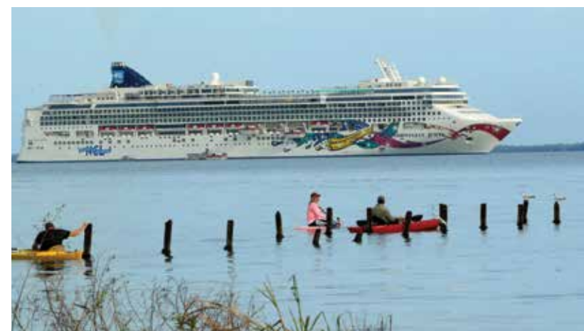
Reglas claras, seguridad jurídica y acciones de transparencia implementadas por el Presidente Hernández mejoran el clima de inversión en Honduras. En el 2014 se reportaron importantes logros en el sector turismo.