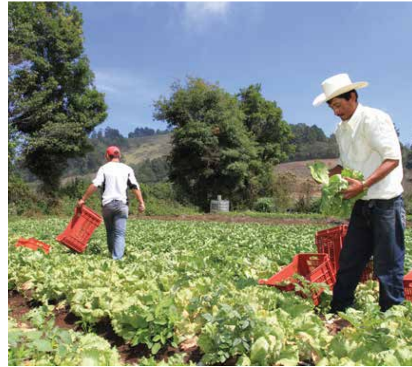
En materia agrícola se otorgaron más de nueve mil nuevos préstamos por 1.860 millones de Lempiras.