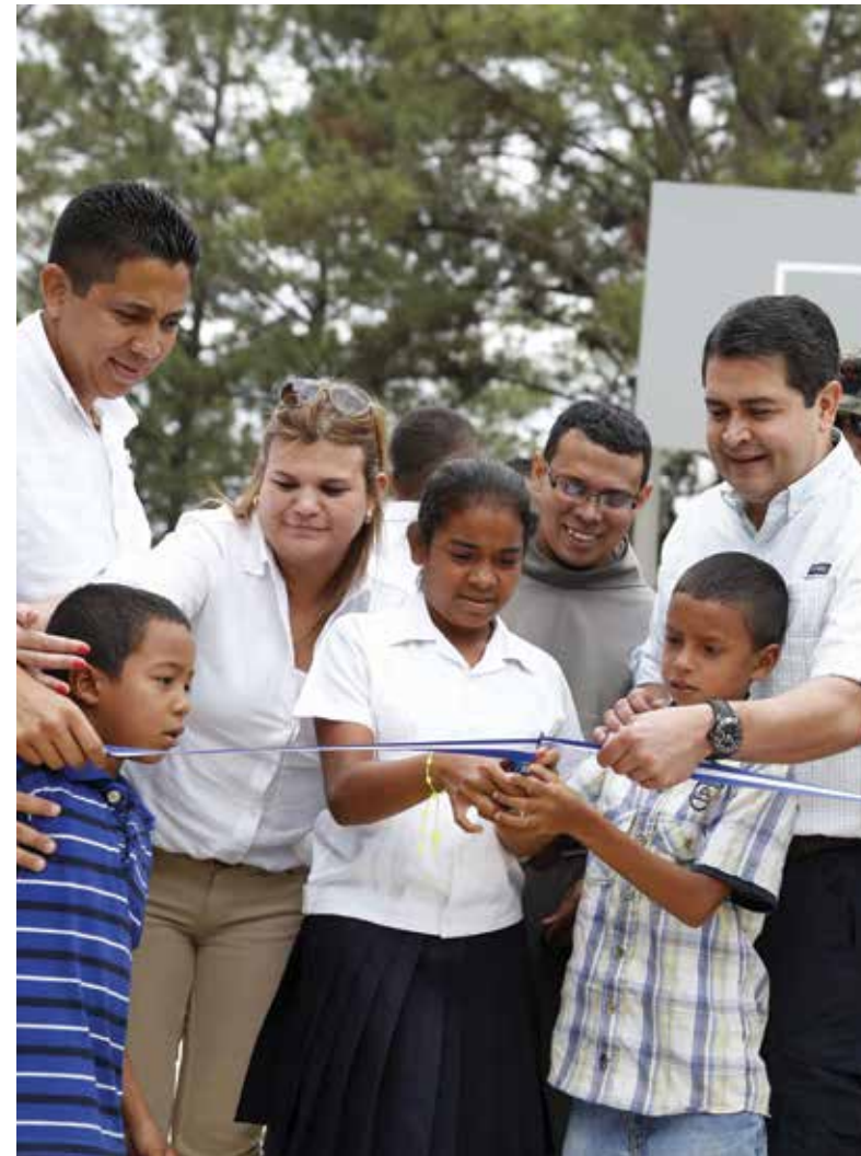
El mandatario hondureño creó el Gabinete de Prevención en Seguridad que impulsa diversos programas encaminados a fortalecer los valores morales y espirituales en la niñez y juventud para evitar que estos sean blancos del crimen y las pandillas.

Además con el apoyo de organismos internacionales a través del Programa Nacional de Prevención y Rehabilitación - Reinserción Social se logró llegar a unos 24 mil menores con actividades en pro de una cultura de paz y sana convivencia.