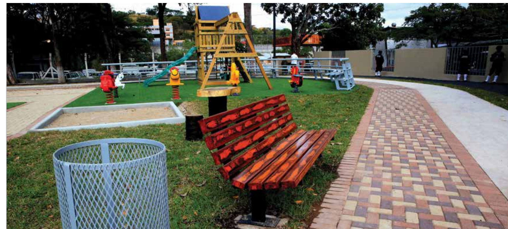
Los espacios de recreación están equipadas con internet gratis, senderos y áreas de descanso.